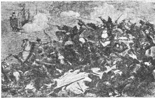
Отраженіе нашествія Монголовъ.

Воинственная часть населенія Японскихъ острововъ бурно проявляла свою жизнедѣятельность. Междоусобныя войны чередовались съ набѣгами на сосѣдей, и въ результатѣ назрѣвала высокая патріотичность японцевъ. Грандіозная попытка Хубилай-Хана, монгольской династіи, высадиться сначала на Цусиму, а затѣмъ на Кіу-Сіу, со ста тысячами китайцевъ, корейцевъ и монголовъ, потерпѣла неудачу: въ жестокомъ бою пришельцы были истреблены — патріотическіе памятники и картины свидѣтельствуютъ объ этомъ послѣднемъ покушеніи континентальныхъ жителей подчинить себѣ острова, что относится къ 1274 и 1281 годамъ нашей эры.