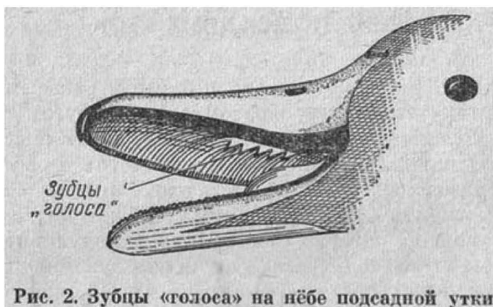
Рис. 2. Зубцы «голоса» на нёбе подсадной утки

Если прослушать утку не удастся, можно прибегнуть к следующему приему: открыть ей клюв и осмотреть нёбо - внутреннюю поверхность верхней части клюва. Посередине нёба продольно расположен узкий валик, рассеченный на отдельные мелкие бугорки или зубчики (рис. 2). Этих бугорков у подсадных и диких кряковых уток бывает от двух до восьми. Существует зависимость между строением голосового аппарата и количеством зубцов. Например, утки с четырьмя зубцами (четырёхзубки) очень часто обладают хорошими голосами. Такой же способ отбора применяется и в случае, если приходится иметь дело с совсем молодыми утками, голоса которых еще не установились. Отбирать лучше всего четырёхзубок.