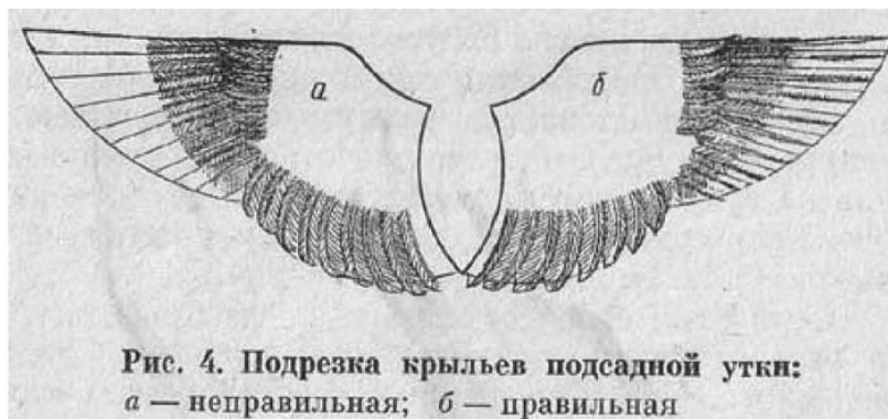
Рис. 4. Подрезка крыльев подсадной утки: а — неправильная; б — правильная

При содержании подсадных осень довольно хлопотливое время. Молодые и старые утки перелиняли, первые получили способность летать, но этой способности их нужно лишить. Для этого подсадным следует подрезать или, как говорят охотники, "подперить" крылья. Данную операцию можно проводить только после того, как перья в крыльях окончательно окрепнут. Мягкие "кровяные" перья трогать нельзя, так как их можно легко поломать. Многие охотники просто обрезают все маховые перья первого порядка на 2/3 их длины, но это создает для утки ряд неудобств, которые в дальнейшем сказываются на ее пригодности к охоте. Дело в том, что маховые перья служат утке не только для полета. Плавая на воде, утка прижимает ими рыхлое оперение боков, предохраняя его от намокания. Поэтому лишившись маховых перьев, утка, высаженная на воду, начинает подмокать, зябнет, старается выбраться на сухое место и хуже работает.