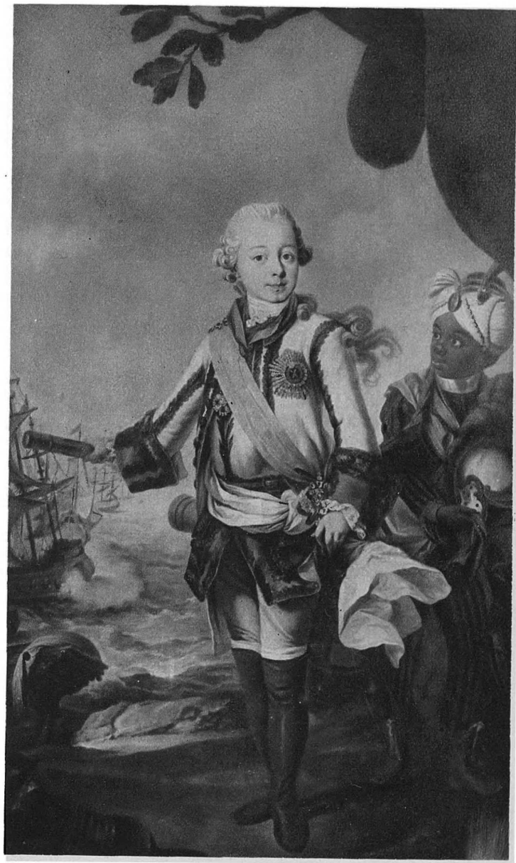
ИМПЕРАТОРЪ ПАВЕЛЪ I, Генералъ-Адмиралъ. (Съ портрета въ Морскомъ музеѣ имени Императора Петра Великаго.)