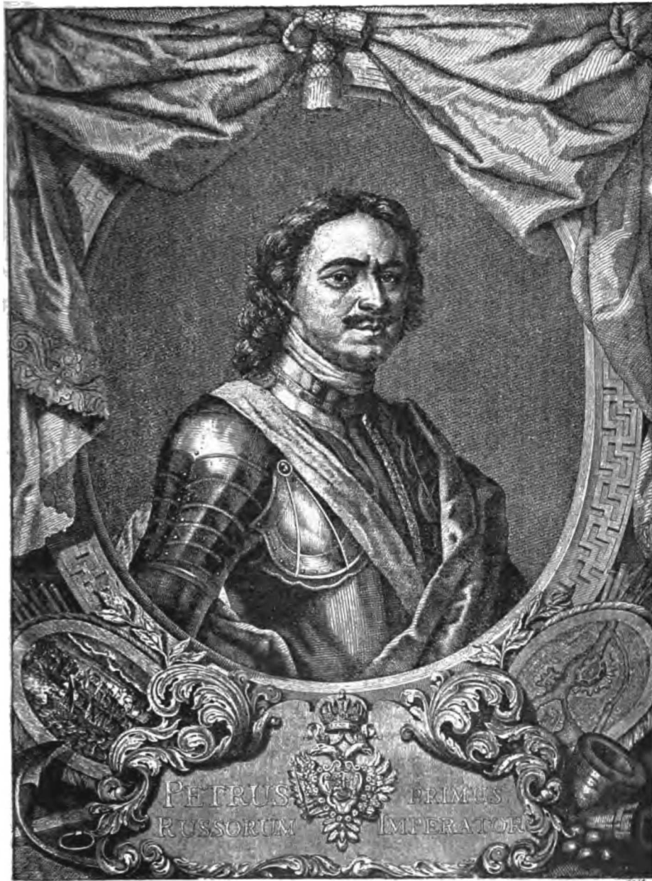
ИМПЕРАТОРЪ ПЕТРЪ ВЕЛИКІЙ.