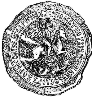
Печать Феодора Борисовича.

стали стекаться и разные русскіе подонки и всё недовольные Борисомъ. Многіе города Сѣверской украины добровольно сдались самозванцу, какъ подлинному Димитрію. Но Новгородъ Сѣверскій, защищаемый воеводой Петромъ Басмановымъ, остался вѣрнымъ Борису и мужественно отбилъ отъ самозванца. Сюда подошло царское войско подъ начальствомъ князя Мстиславскаго. Но уже и ратными людьми овладѣло сомнѣніе, не поднимаютъ ли они рукъ противъ своего законнаго государя. По выраженію лѣтописи, у русскіхъ людей не было рукъ для сѣчи. Мстиславскій потерпѣлъ пораженіе. На мѣсто этого раненаго воеводы посланъ былъ съ войсками князь Василій Ивановичъ Шуйскій и нанесъ пораженіе самозванцу при Добрыничахъ. Но воеводы не воспользовались этой побѣдой и дали Лжедимитрію оправиться при помощи новыхъ подрѣпленій. Сила