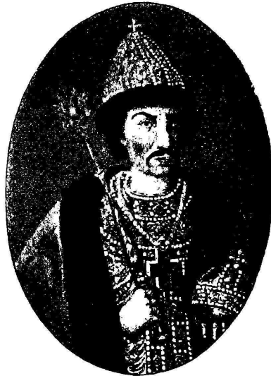
Борисъ Годуновъ *).

польской шляхты. Вѣсти обо всемъ этомъ доходили до Москвы, чрезвычайно волновали Бориса Годунова, обрадовали нелюбившихъ его, да и всѣхъ русскихъ людей привели въ сильное возбужденіе. Годуновъ принималъ всяческія мѣры противъ успѣховъ самозванца. Онъ велѣлъ охранять отъ перехода польскую границу, патріархъ Іовъ отлучилъ самозванца отъ церкви и предалъ въ храмахъ анаѳемѣ. Борисъ издалъ грамоту, разоблачавшую его происхождение и самозванство. Въ ней онъ назывался бѣглымъ монахомъ Гришкой Отрепьевымъ. Но эти