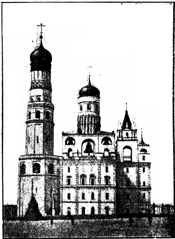
Колокозня Ивана Великаго.

— — наукамъ и чужимъ языкамъ, посылалъ русскихъ учиться за границу. Первые годы правленія Бориса были вполне благополучны. Но вотъ Россію посѣщаютъ различныя бѣдствія. Съ 1601 года начался у насъ страшный неурожай, продолжавшійся два года подрядъ и вызывавшій сильный голодъ и моръ. Въ теченіе двухъ лѣтъ въ одной Москвѣ погибло до 127,000 человекъ. Бо-