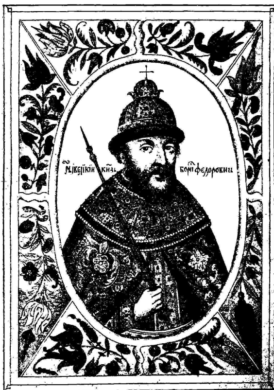
Борисъ Феодоровичъ Годуновъ. По Титулярнику.

женія подѣ именемъ Александры въ Новодѣвичьемъ монастырѣ, опять никто не заговорилъ о выборѣ государя и, по слову начальнаго челоуѣка—патріарха, всѣ готовы были безъ выборнаго сейма присягнуть правителю государства Борису Феодоровичу Годунову, какъ царю. Если же былъ созванъ избирательный земскій соборъ, то этого хотѣлъ никто другой, какъ самъ Годуновъ, думавшій, что избраніе соборомъ сдѣлаетъ его родъ прочіе на престолѣ, чѣмъ одно провозглашеніе народомъ и