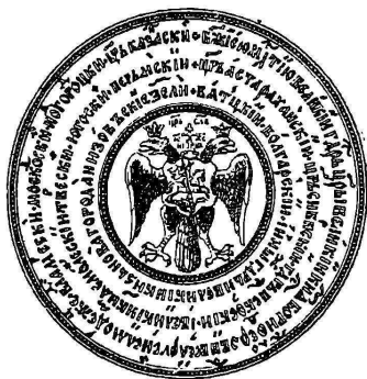
Печать Бориса Годунова.

Семилѣтнее царствованіе Бориса Годунова (1598—1605) представляетъ поразительную картину того, какъ родоначальникъ новаго Царствующаго Дома выбивается изъ силъ устоять подъ тяжестью обгаревныхъ царственной кровью бармъ Мономаха и какъ падаетъ онъ подъ этимъ непосильнымъ для него бременемъ. Эта картина гениальными чертами нарисована нашимъ ве-