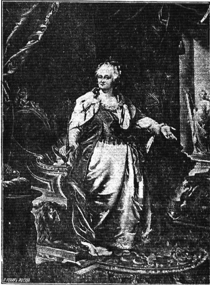
ИМПЕРАТРИЦА ЕКАТЕРИНА. II