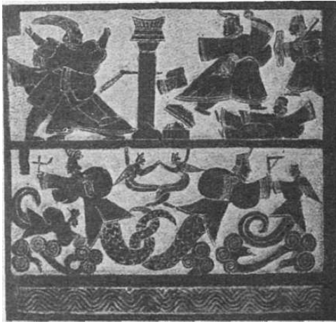
Наверху изображено покушение на Шихуанди; внизу — два божества с драконовыми хвостами (рельеф на стене древней могилы).

Эта перемена правописания вызвала сильное недовольство в среде образованных чиновников бывших удельных княжеств, которые держались учения Конфуция, крепко стояли за старину и за самостоятельность областей. Ли-Сы не остановился перед самыми суровыми средствами борьбы. Он сделал императору следующий доклад: «Вы, государь, открыли новые пути и способы управления, благодаря которым навеки должна утвердиться Ваша августейшая фамилия. Все приветствуют и почтительно встречают их кроме книжников, которые не хотят на них согласиться.