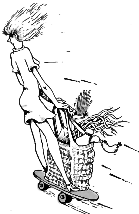
Рис. В. Цимбалистова

Телефоны: 457-26-75, 158-18-89, 299-99-56.