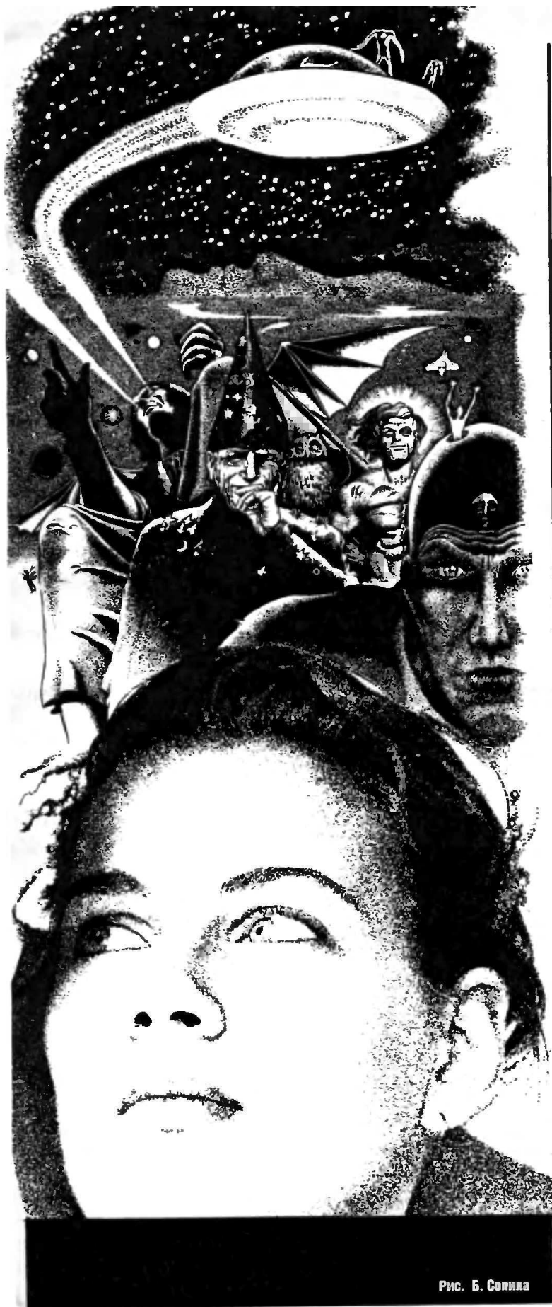
Рис. Б. Солина

В Португалии есть место, где некоторое время назад на участке 20 на 20 метров в 16 часов ежедневно лил дождь. Из чистого неба. Из ниоткуда.