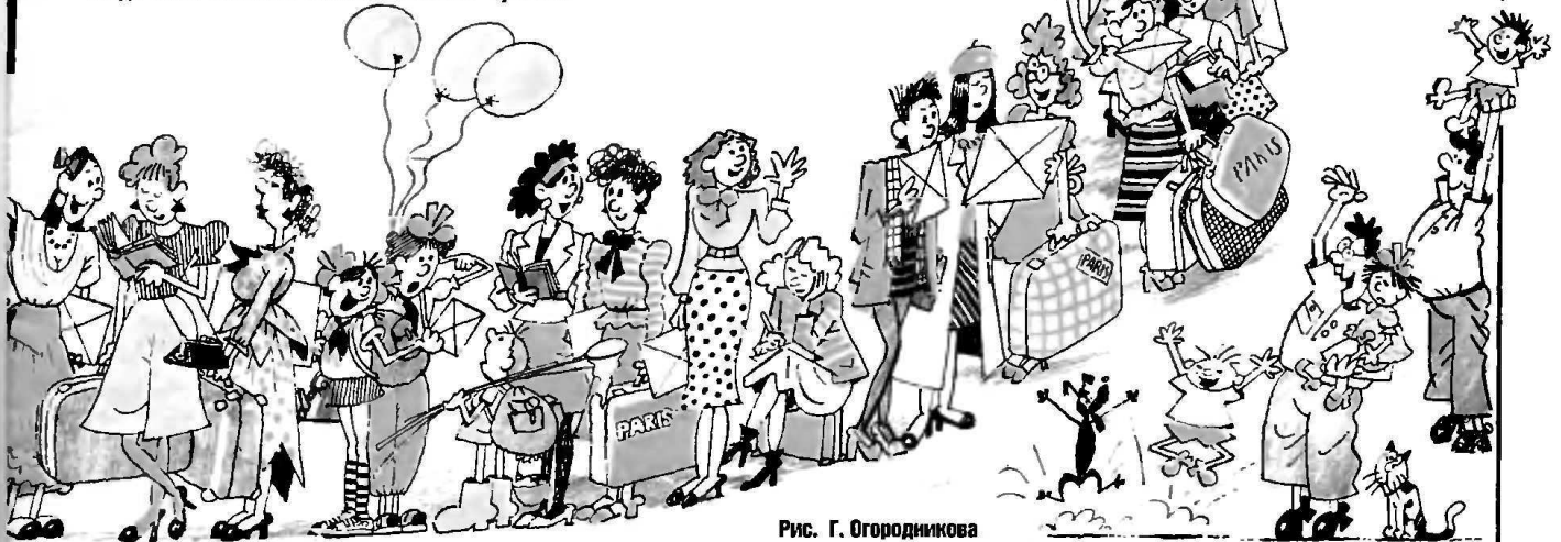
Рис. Г. Огородникова

Из остальной муки, масла, соли, сахара и половины яиц замешивается тесто средней густоты. В процессе его вымешивания добавляются остальные яйца. Затем это тесто соединяется с опарой, хорошо вымешивается. Готовое тесто ставят на 2 часа в теплое место для подъема, затем, поднявшееся, вымешивают еще раз и ставят на холод, чтобы затвердело. Когда тесто остынет, из него выпекают булочки.