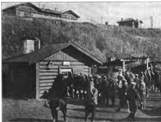
За кипяткомъ на Сибирской жел. дорогѣ.

Въ Петропавловскѣ, бойко отстраивающемся городкѣ, стоящемъ на широкой рѣкѣ Ишимѣ, притокѣ Иртыша, уже видимо проявилось заселеніе евреями, выстроившими для себя большую въ два этажа молельню (синагогу), видимую издалика.