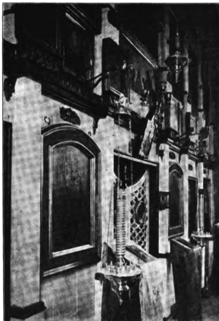
Рис. 4. Иконостасъ въ Старо-Шарковской церкви.