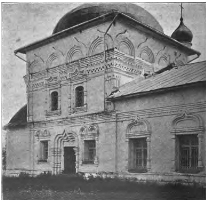
Рис. 8. Сивковская Преображенская церковь 1687 г.

Должены: 1) Старое дѣлопроизводство по вопросу о расширеніи этой церкви, построенной и освященной патріархомъ Іоакимомъ. Въ 1902 г. причтъ