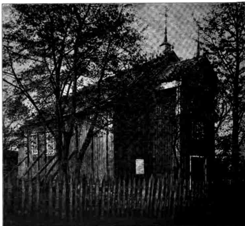
Рис. 2 и 3. Старо-Шарковская Успенская церковь 1639 г.