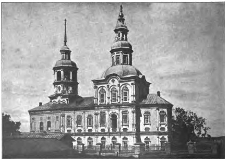
Рис. 7. Истобенская Николаевская церковь 1686 г.