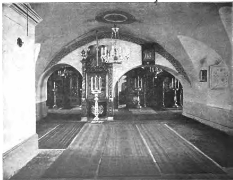
Рис. 5 и 6. Вологодская Николаевская Глинковская церковь 1676 г.