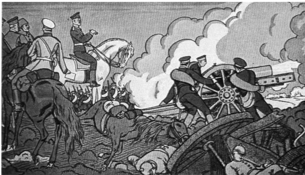
Французскій лубокъ. — Великій Князь Николай Николаевичъ руководить боемъ на Варгѣ.

начала октября, когда мы, собрав на правом завислинском фланге большой кулак (по германским данным, у нас было превосходство там в 90 батальонов или тысяч), опрокинули противника обратно на линию Калиш–Ченстохов. Дольше всего держался противник на Висле у Сандомира. Преследуя их по прибрежной дороге у Вислы на Краков, наши войска переправлялись и на галицийский берег Вислы и тем облегчали и операции наших галицийских