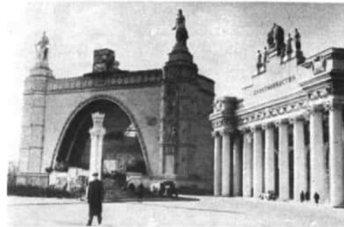
Павильон механизации и электрификации сельского хозяйства. Справа — павильон «Животноводство».