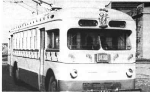
Завод имени Урицкого в городе Энгельсе изготавливает 20 троллейбусов для Всесоюзной сельскохозяйственной выставки. Эти троллейбусы будут ходить по территории выставки.