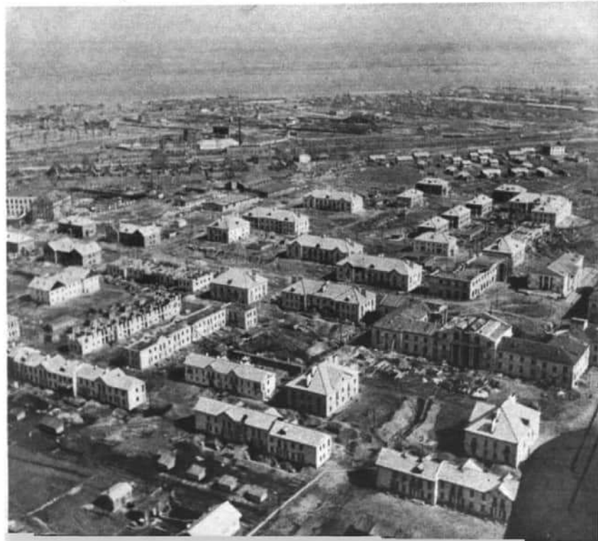
Поселок строителей Заволжья.