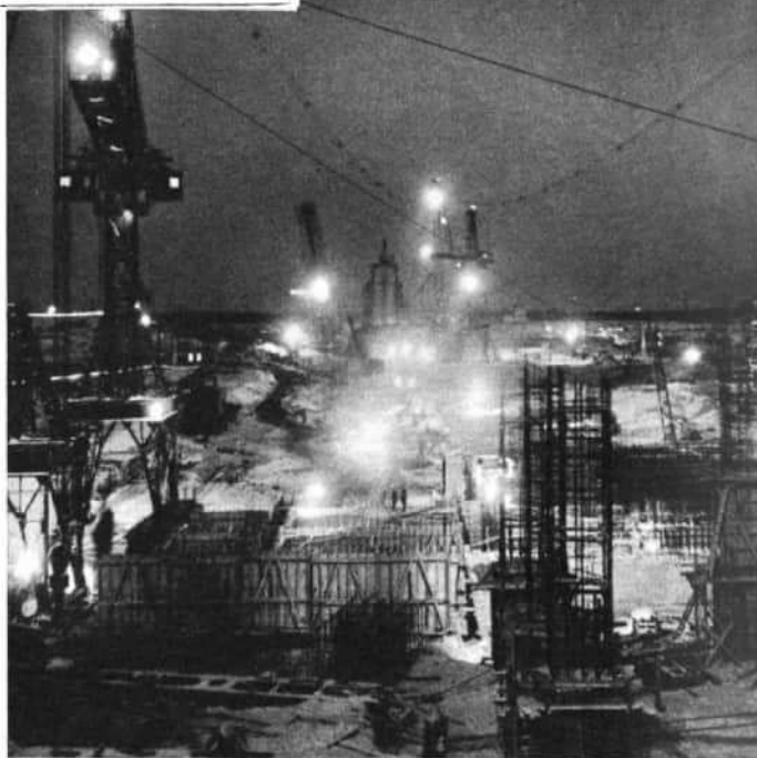
Почью в котловане.

по величине в Европе после Днепровской гидроцентрали имени В. И. Ленина. Щербаковский гидроузел — третья ступень каскада.