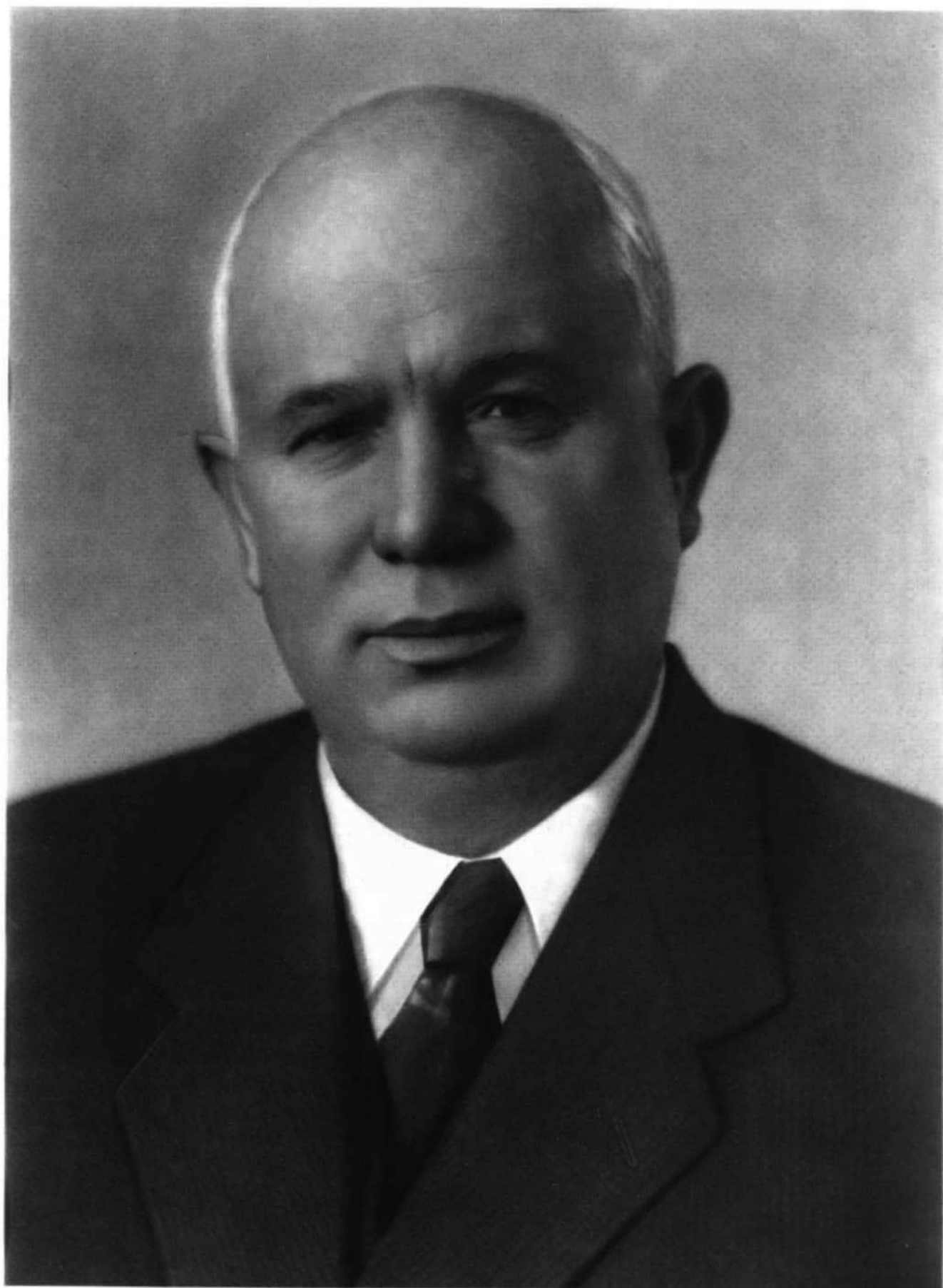
НИКИТА СЕРГЕЕВИЧ ХРУЩЕВ. К 60-летию со дня рождения.