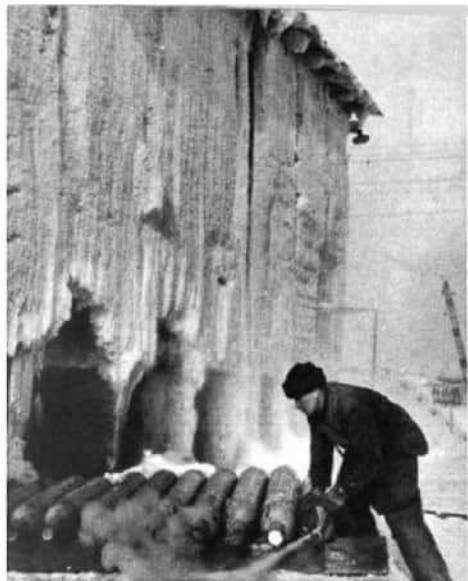
Ледяными стенами поднялась морозильная установка.

плотины, перемычки, шлюзы, бетонные заводы, краны, экскаваторы, караваны машин. На низком песчаном берегу среди тальников и ракии белеют каменные дома поселка энергетиков — Заволжья. Его собрат, такой же асный и четкий городок, расположился на другом, гористом берегу.