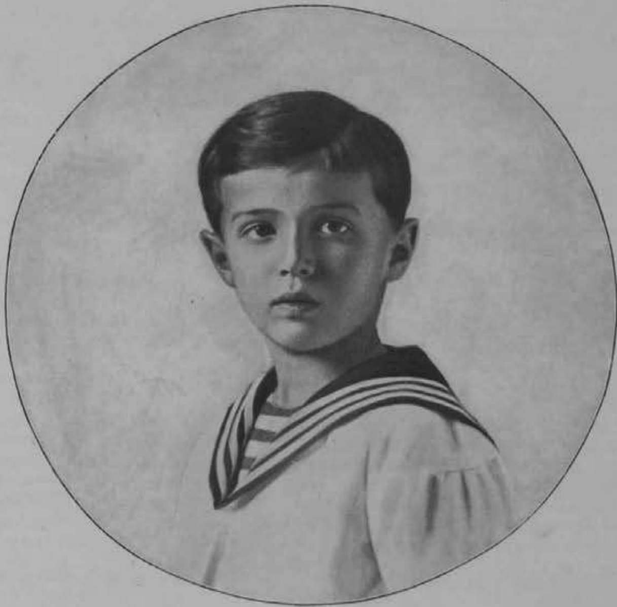
ЕГО ИМПЕРАТОРСКОЕ ВЫСОЧЕСТВО НАСЛЕДНИКЪ ЦЕСАРЕВИЧЪ и ВЕЛИКІЙ КНЯЗЬ АЛЕКСѢЙ НИКОЛАЕВИЧЪ.