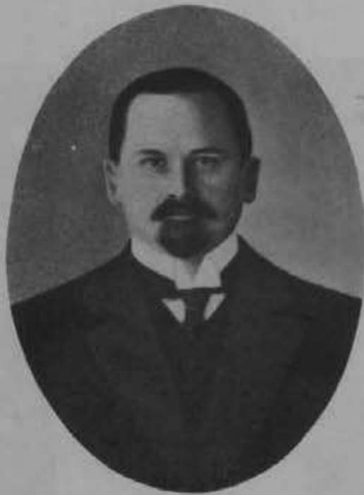
Государственный Секретарь, сенаторъ, т. с. С. Е. КРЫЖАНОВСКІЙ.