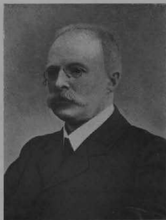
Министръ Торговли и Промышленности т. с. С. И. ТИМАСХЕВЪ.