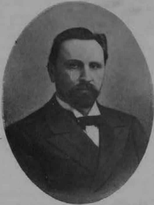
Главнуправляющій Землеустройствомъ и Землевліемъ статсъ-секретарь, гофмейстеръ. А. В. КРИВОШЕИНЪ.