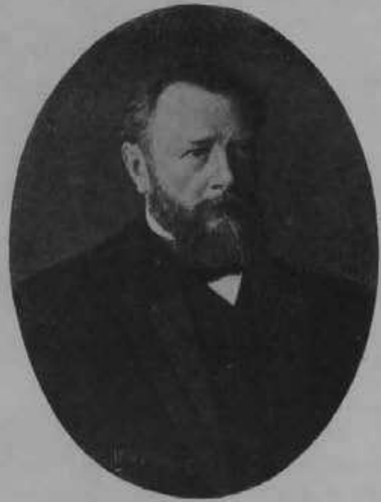
Министръ Путей Сообщенія статсъ-секретарь, д. т. с. С. В. РУХЛОВЪ.