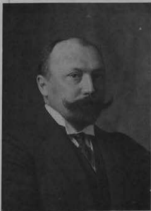
Министръ Финансовъ т. с. П. Л. БАРКЪ.