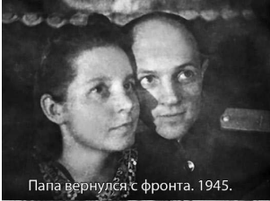
Папа вернулся с фронта. 1945.