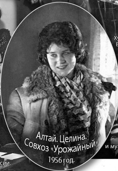
Алтай. Целина. Совхоз «Урожайный» 1956 год.