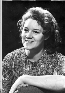
Домана Преображенке. 1974.