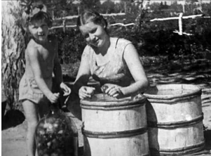
Урал. Эвакуация. Голода избежали. 1943.