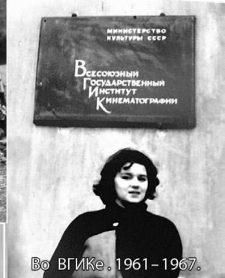
Во ВГИКе. 1961-1967.