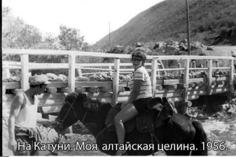
На Катунь. Моя алтайская целина. 1956.