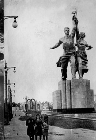
Родное Останкино. Мама, папа и я. 1945.