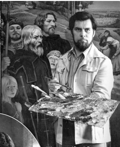
Художник Юрий Ракша. В своей мастерской. У триптиха «Поле Куликово» (Третьяковская галерея). 1980 год.