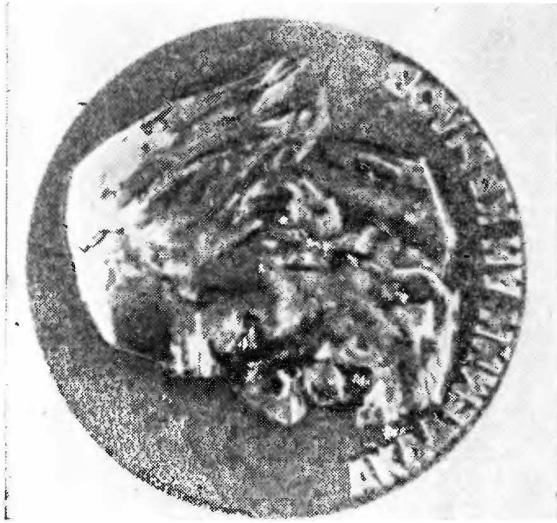
Настольная медаль к 100-летию со дня рождения А. Н. Крылова