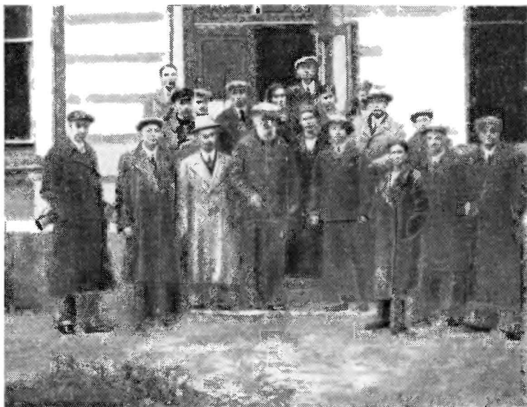
А. Н. Крылов среди сотрудников конструкторского бюро в г. Казани, 1942 г.