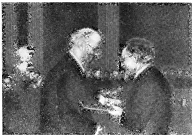
М. И. Калинин вручает А. Н. Крылову «Золотую Звезду» Героя Социалистического Труда и орден Ленина