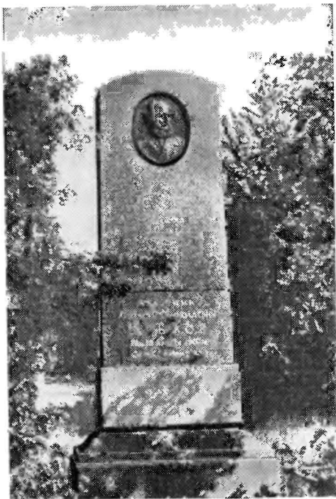
Могила А. Н. Крылова на Волковом кладбище в Ленинграде

Мне как специалисту в области географии очень трудно дать оценку многогранной деятельности А. Н. Крылова. Поэтому я отсылаю интересующихся к названным выше изданиям. В настоящем издании «Мои воспоминания», как я говорил раньше, сохранена структура последнего прижизненного издания, подписанного к печати 22 сентября 1945 г. В книгу