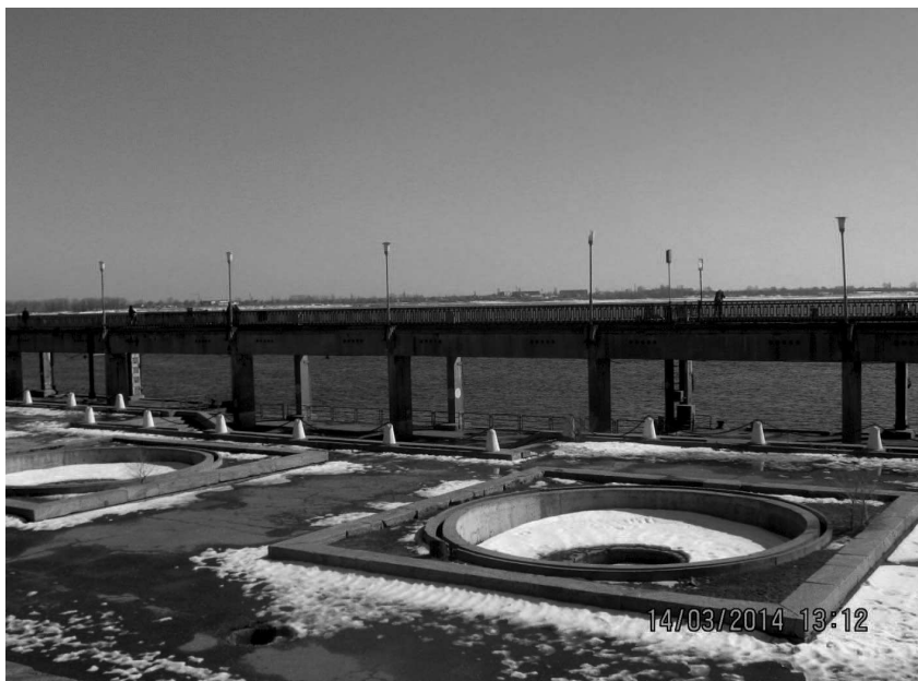
Фото: Причальная стенка речного вокзала.

К вокзалу примыкает километровая причальная стенка. Она частично видна нам.