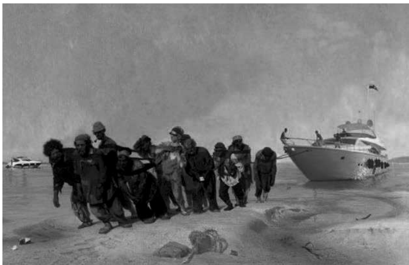
Картина Репина «Бурлаки на Волге».

Видела Волга и вольницу Степана Разина, и войска Емельяна Пугачёва, помнит Волга и горе народное, запечатлённое кистью Репина и пером Некрасова, знает Волга и величайшее сражение за свободу народа.