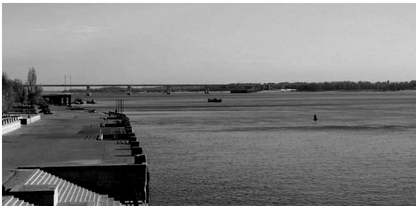
Фото: Левый берег Волги, новый железобетонный мост — связь с левым берегом Волги.

Связь с левым берегом осуществляется через мост, посредством катеров и плотину Волжской ГЭС.