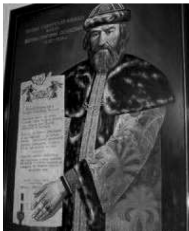
Картина: Григорий Осипович Засекин, основатель г. Царицына, с грамотой.

с древних времён действовала Волго-Донская перволока, то есть здесь перволоакивали суда из Волги в Дон и обратно. Когда-то эта земля была сердцем Золотой Орды. При Иване Грозном перволока и волжский путь охранялись разъездными караулами опричников от Казани до Астрахани. Но Нижняя Волга постоянно подвергалась нашествиям кочевников и нуждалась более надёжной охране. В царской грамоте Фёдора Блаженного воеводам князьям Григорию Осиповичу Засекину, Роману Васильевичу Ольфёрову и Ивану Афанасьевичу Нащёкину поручалось 2 июля 1589 года построить на перволоке город — острог.