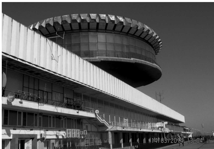
Фото: Речной вокзал.

Мы находимся на нижней террасе набережной имени 62 Армии. Маршрут экскурсии начинается от здания речного вокзала, который вы видите справа.