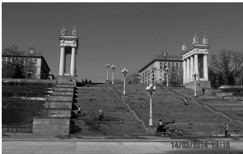
Фото: Парадный вход в город со стороны Волги.

На фасадах зданий вы видите золотую звезду и орден Ленина, которыми был награждён Волгоград за оборону Сталинграда, с присвоением звания город-герой.