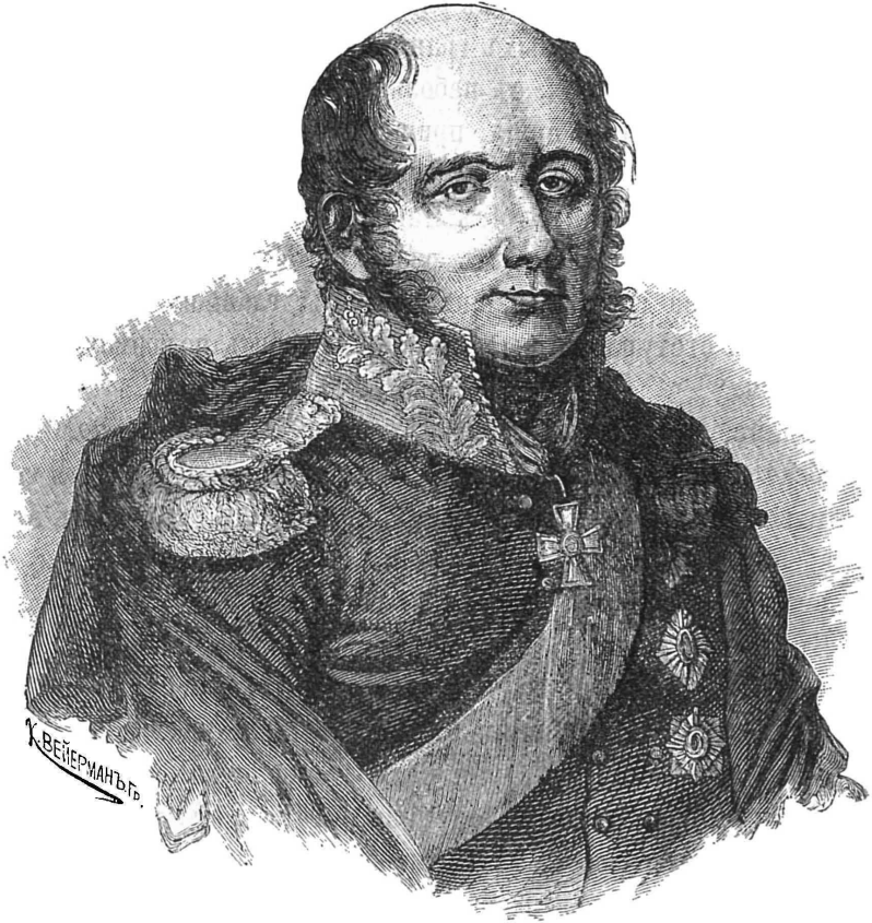
Барклай де - Толли.

Никогда я не забуду послѣднихъ словъ прочитаннаго намъ манифеста о началѣ войны. Государь, объясняя въ немъ причины вражды Наполеона и неуспѣшность всѣхъ миролюбивыхъ мѣръ отклонить войну, сказалъ: «Воины! Вы защищаете вѣру,