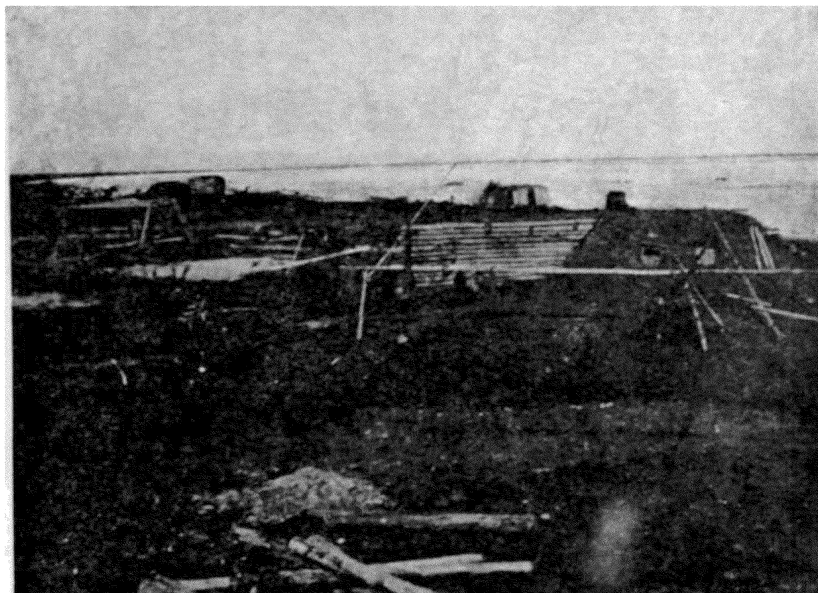
Рис. 1 Въ Русскомъ Устьѣ въ полночь.

Находится Русское Устье на крайнемъ сѣверѣ Восточной Сибири, на рѣкѣ Индигиркѣ, въ 80-ти верстахъ отъ Ледовитаго океана; точное географическое положеніе этого мѣста— 71^{\circ}1' сѣверной широты 149^{\circ}26' восточной долготы 1) . Оно почти на два съ половиной градуса сѣвернѣ Нижне-Ко-