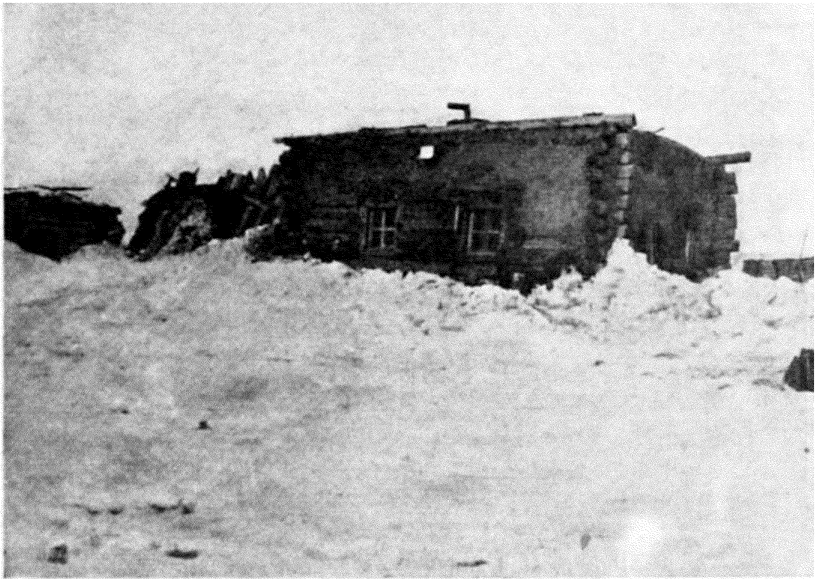
Рис. 4 Мой домикъ.

По сохранившемуся отъ стариковъ преданію, предки здѣшнихъ мѣщанъ были выходцами изъ Россіи. Спасаясь отъ тягостей ратной службы 1) , жители разныхъ городовъ еще при Иванѣ Грозномъ 2) на ботахъ и кочахъ вышли изъ Россіи