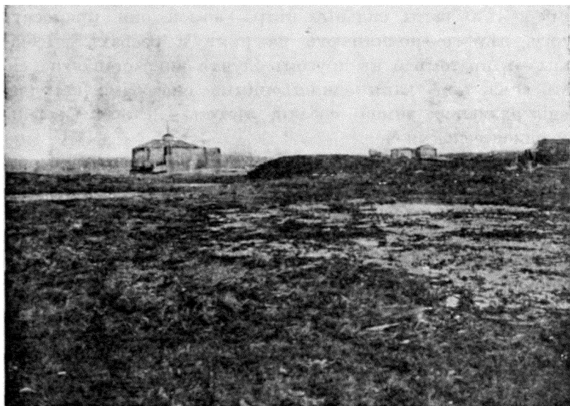
Гис. 3. Въ Русскомъ Устьѣ: видъ на часовню.

Зимою здѣсь часты жестокия пурги, во время которыхъ снѣгъ можетъ засыпать домъ—выходить въ это время на улицу не безопасно; послѣ такихъ пургъ приходится откапываться изъ-подъ снѣга, какъ изъ-подъ обвала. Зимняя обстановка очень печальна—кругомъ, куда ни взглянешь, безпредѣльная снѣжная пустыня, на которой скоро устаютъ глаза, а самый поселокъ, съ нѣсколькими полузасыпанными домами, со стороны еле замѣтенъ. Лѣтомъ съ крыши дома видны всюду безчисленныя заливныя озера и болота (лайды