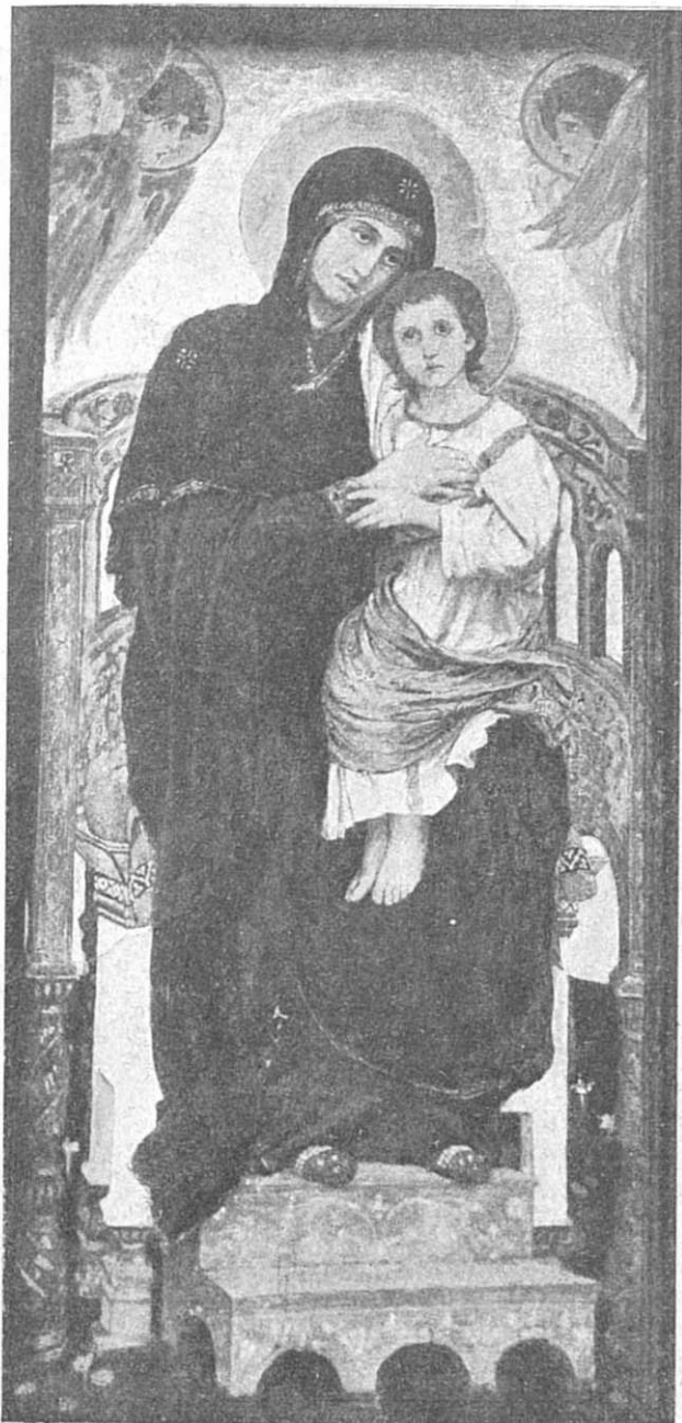
В. М. Васнецовъ. — Богоматерь съ Предвѣчнымъ Младенцемъ

В. М. Васнецовъ воспользовался для своей церковной живописи многими образами и представленіями древне-русскихъ иконописцевъ, подчасъ даже подчеркивая и усиливая ихъ символику. Лицамъ святыхъ онъ