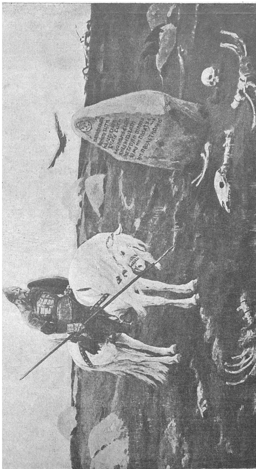
В. М. Васнецовъ. — Витязь на распутьи.