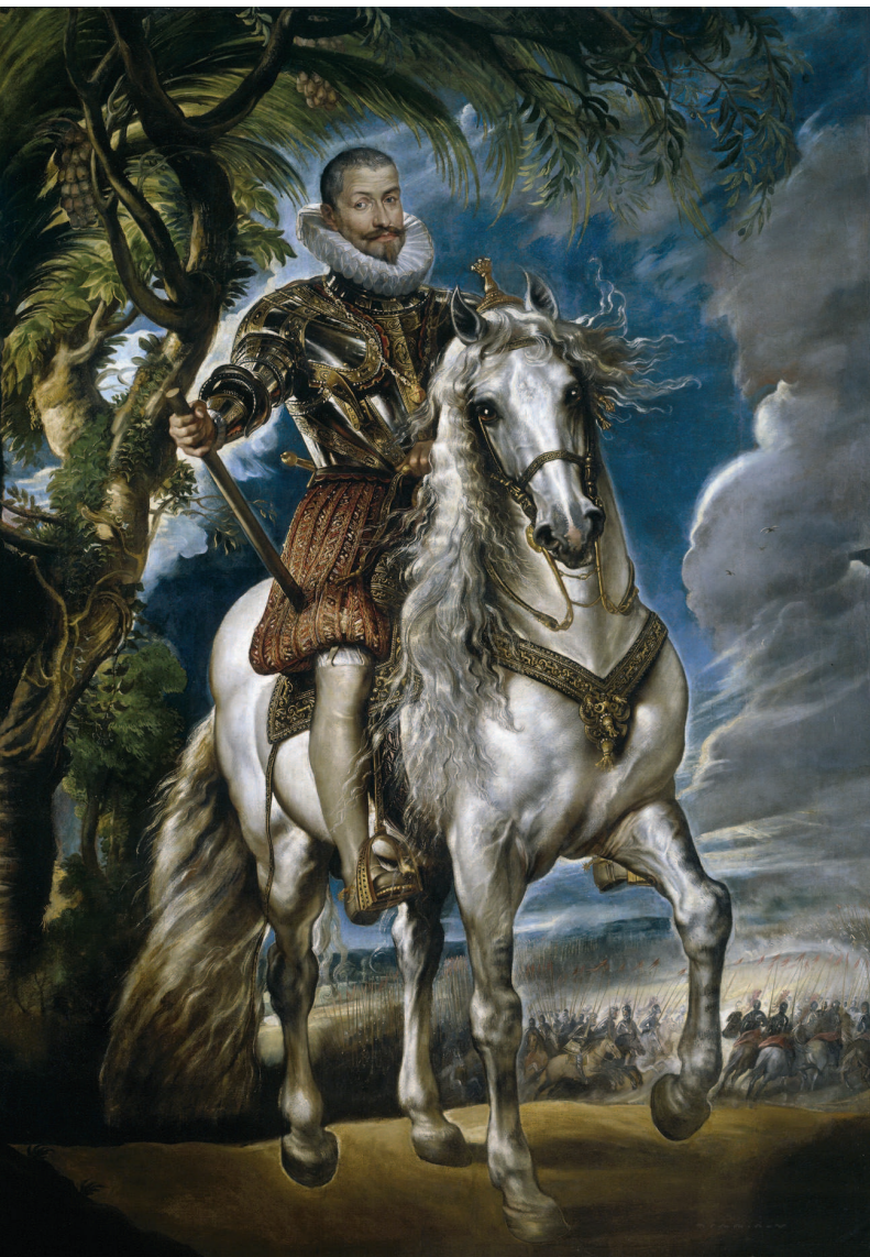
«Конный портрет герцога Лерма», около 1603, холст, масло. Национальный музей Прадо, Мадрид