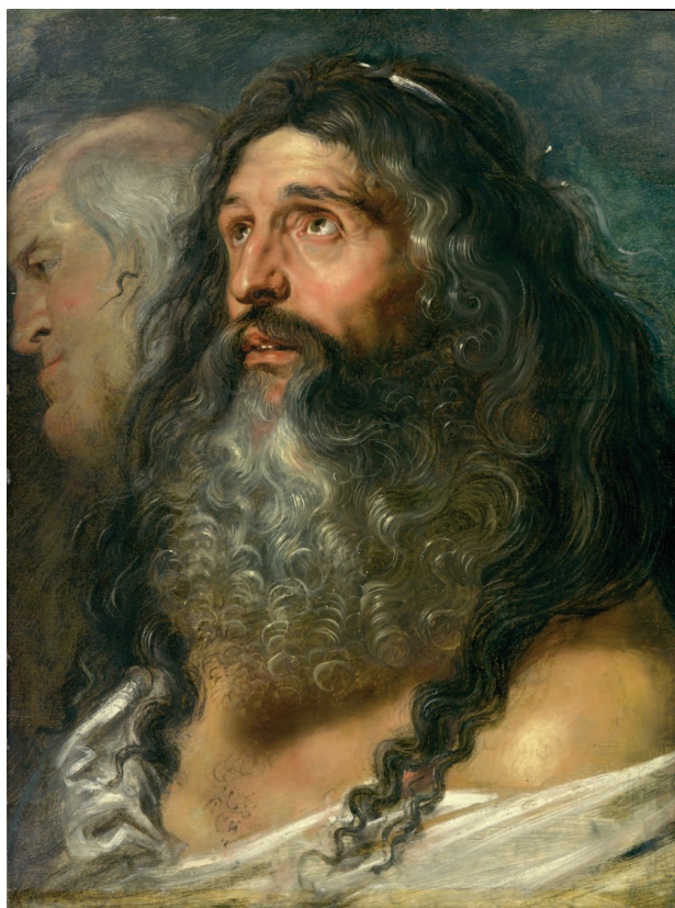
«Изображение двух глав», около 1600, дерево, масло. Метрополитен-музей, Нью-Йорк

Откровенная чувственность, неустанное движение, неповторимый колорит, блеск и величие — все это Питер Пауль Рубенс, знаменитый фламандский живописец, признанный мастер исторической и религиозной живописи. В творчестве Рубенса сочетаются черты традиционного брейгелевского реализма с достижениями венецианской живописной школы, он наделяет свои полотна чувственной красотой и смело вплетает в сюжет элементы реальности. Очень немногие художники, пусть даже и великие, заслужили чести называться основоположниками нового стиля в живописи. Ру-