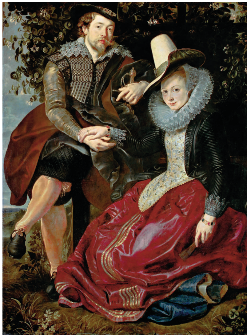
«Автопортрет с Изабеллой Брандт», около 1609, холст, масло. Старая пинаотека, Мюнхен

Картина «Святой Георгий, поражающий дракона» (1606—1610) посвящена известному библейскому сюжету — убиению дракона отважным воином, святым Георгием. Эта картина считается одним из самых ранних самостоятельных произведений Рубенса. Взяв на себя смелость вольно интерпретировать религиозную историю, живописец изобразил самый острый момент схватки между святым и чудовищем. Работая над картиной, он детально прорисовал развевающуюся гриву вставшего на дыбы коня, аккуратными мазками выписал динамичную фигуру готового нанести свой удар всадника. Переосмысливая опыт итальянских мастеров Возрождения, Рубенс сознательно придает новое, иное звучание формам, которые теперь напоминают нам о работах Леонардо да Винчи. Он выписывает энергичные жесты своих героев, не боится резких контрастов света и тени, а сочные краски наделяют все его полотна бурлящей энергией. Обращаясь к богатой палитре теплых оттенков, мастер придает живость изображаемым образам. С неподдельной