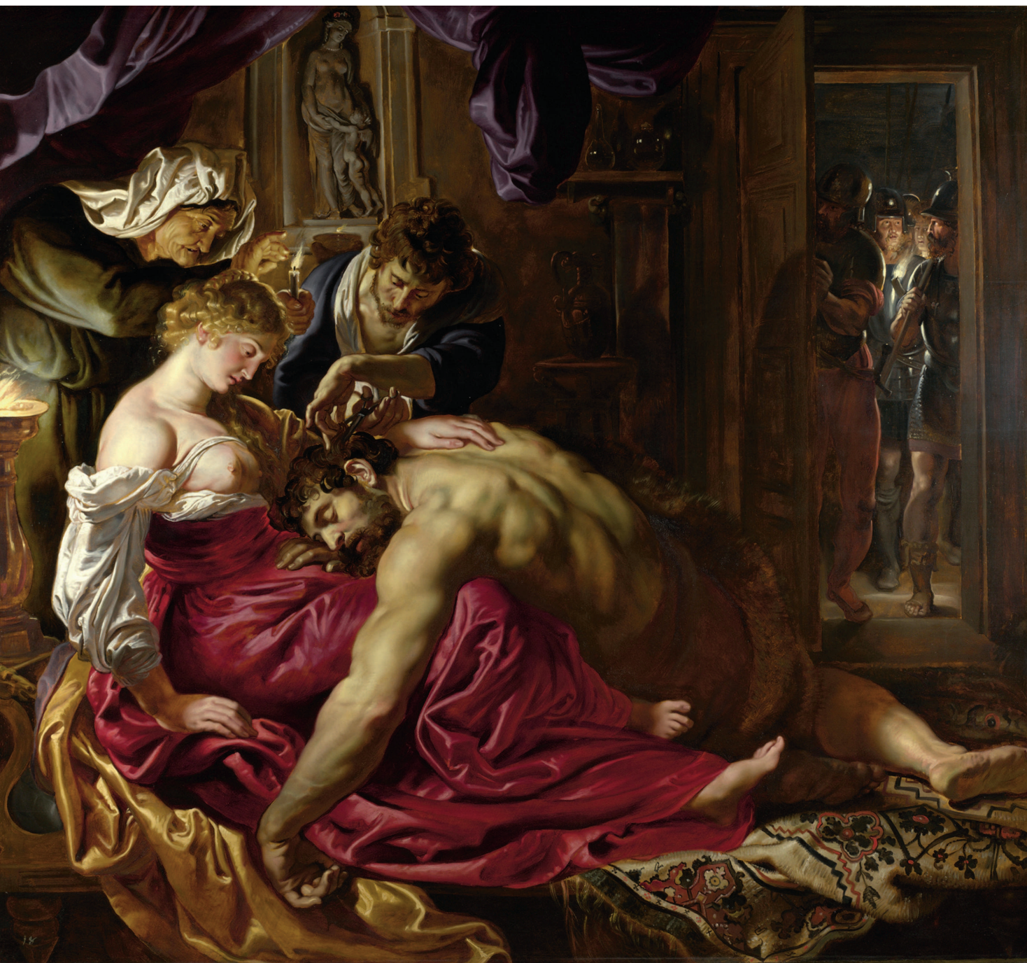
«Самсон и Далила», 1609–1610, холст, масло. Лондонская Национальная галерея, Лондон

Продолжая работать с копиями, Рубенс начинает активнее создавать собственные самобытные работы. Он находит много сю-