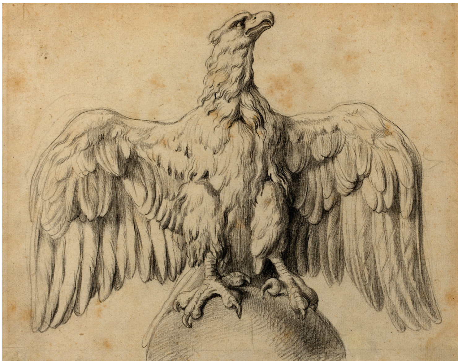
«Капитолийский орел», 1601–1602, бумага, черный мел. Национальная галерея искусств, Вашингтон

четырех лет обучения у ван Веена, в 1598 году, молодой и невероятно талантливый Рубенс был принят свободным мастером в антверпенскую гильдию Святого Луки, а уже в 1600 году отправился получать художественное образование в Италию, всегда считавшуюся колыбелью живописи.