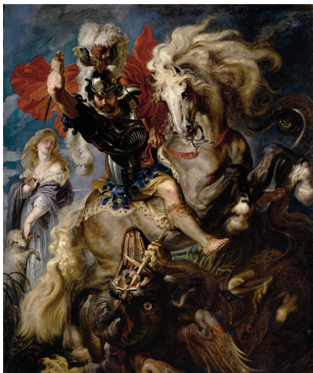
«Святой Георгий, поражающий дракона», 1606–1610, холст, масло. Национальный музей Прадо, Мадрид

В первое время Рубенсом, делающим в основном копии работ великих мастеров прошлого, было исполнено лишь небольшое число