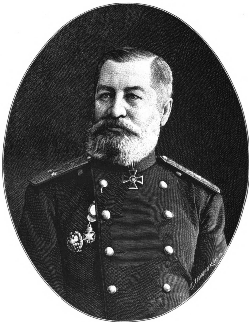
ВСЕВОЛОДЪ ПОРФИРІЕВИЧЪ КОХОВСКІЙ.