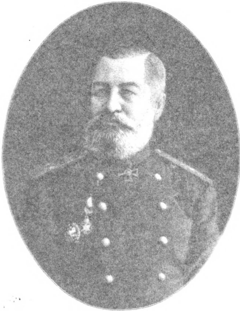
ПОРТРЕТЪ НА ГЕНЕРАЛА ИЗЪ ОХОТНИКА.