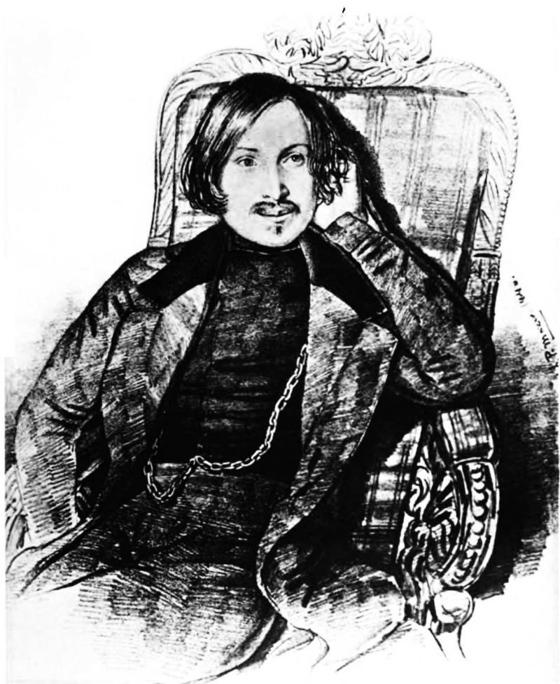
Портретъ работы Мазера 1840 г.