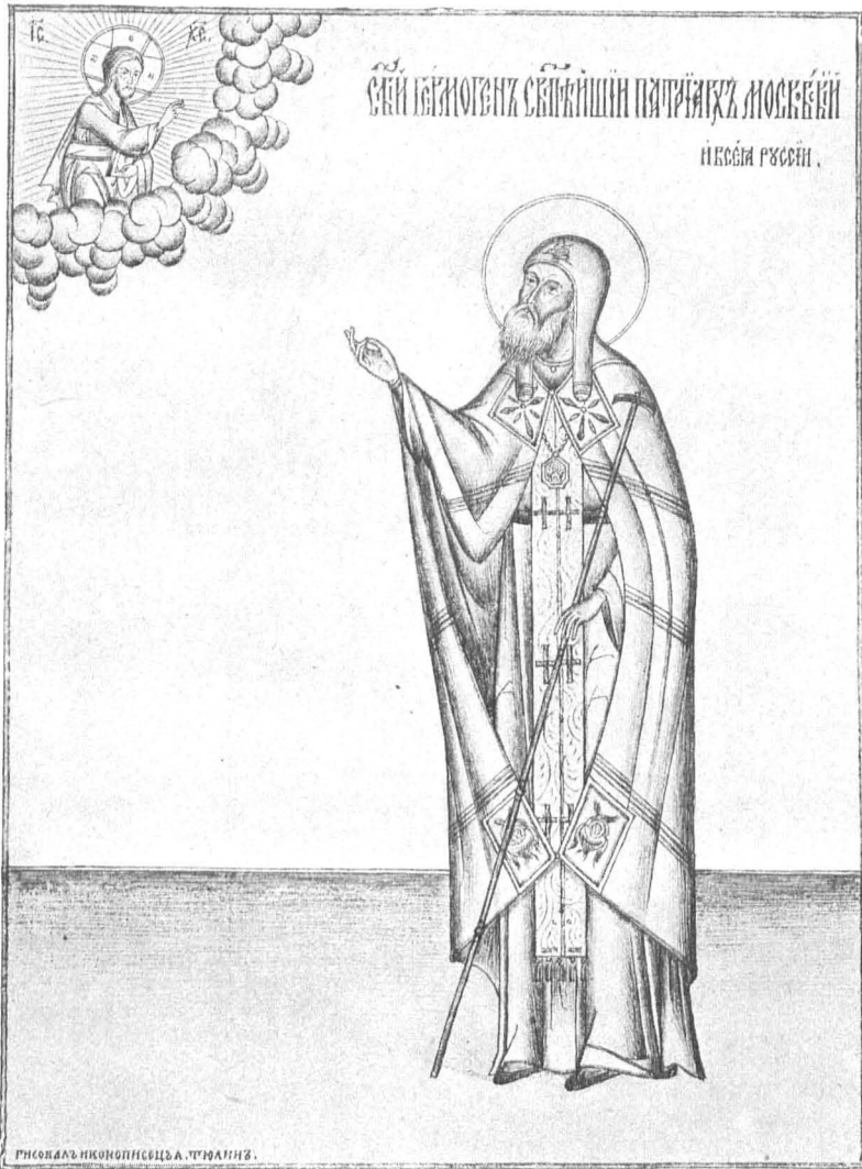
Св. патриархъ Гермогенъ.