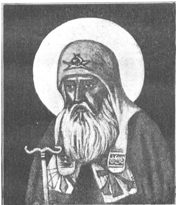
Св. патриархъ Гермогенъ.

По Титулярнику конца XVII вѣка исполнилъ арх.-худ. В. М. Боринъ.