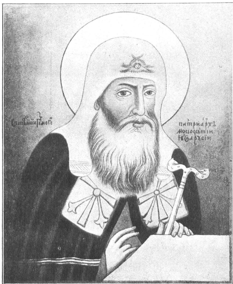
Св. патриархъ Гермогенъ.