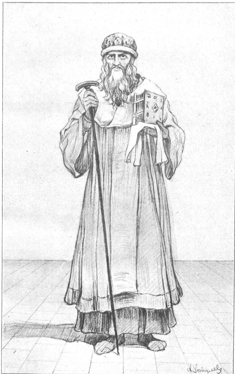
Св. патриархъ Гермогенъ.