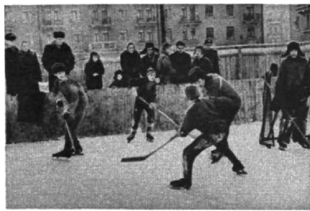
Хоккеисты Люблинской улицы на тренировке.