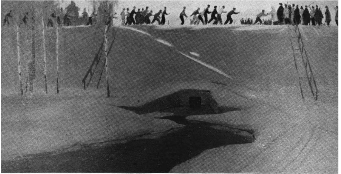
С. Лысенко. НА ФИНИШЕ.