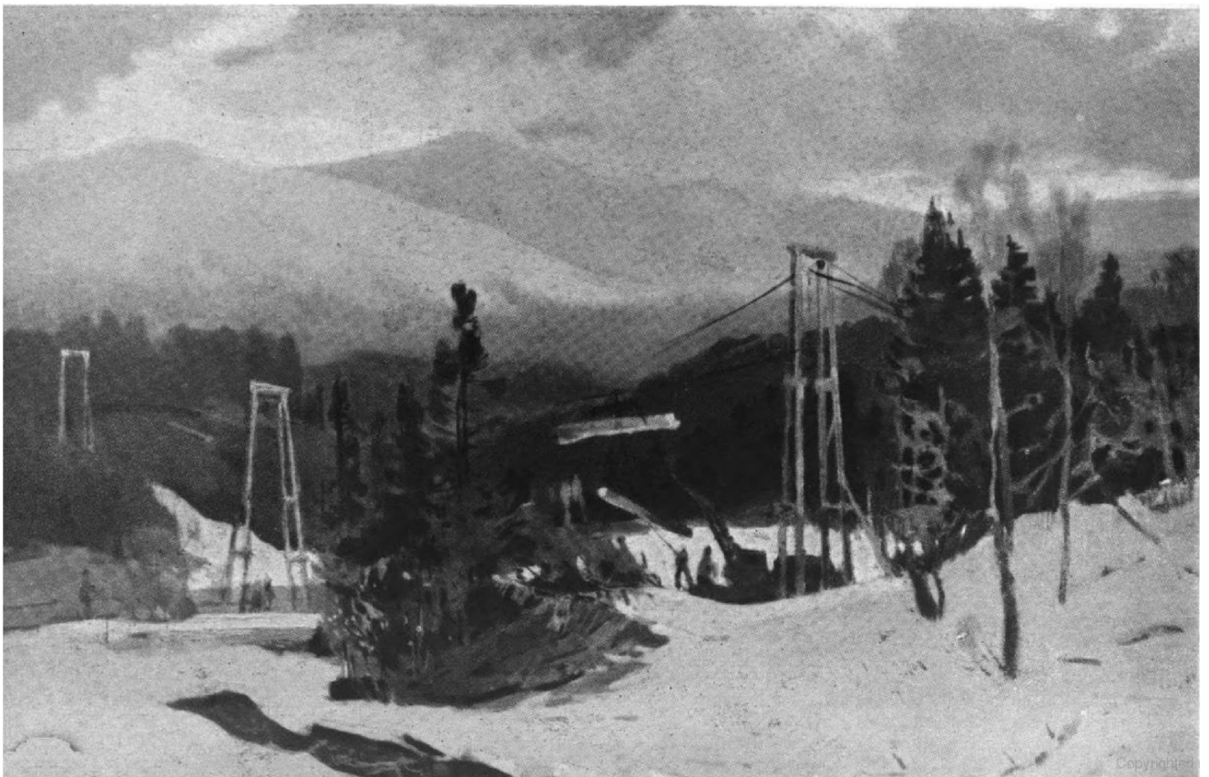
А. Кашшан. ДОЛИНА СВИДОВЕЦ.