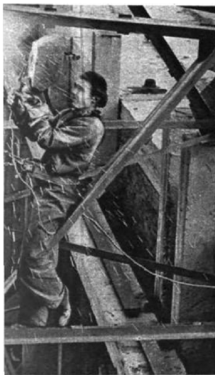
РЕКОНСТРУИРУЕТСЯ И РАСШИРЯЕТСЯ ТБИЛИСКИЙ ЗАВОД имени В. И. Ленина, выпускающий тяжеле-