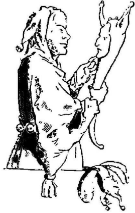
Шутъ (рисунокъ Гольбейна). Изъ книги Эразма «Похвала Глупости».

Шуты и скоморохи появлялись во времена самой глубокой древности; они встрѣчаются не только среди обыкновенныхъ смертныхъ, но и среди боговъ, населявшихъ древній Олимпъ. Эразмъ **) въ своей замѣчательной книгѣ „Похвала Глупости“ рассказываетъ намъ, какъ боги Олимпа любили развлекаться, во время своихъ пиршествъ, выходками и шутками другихъ боговъ.