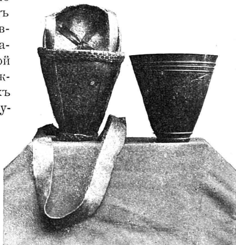
Дорожный стаканъ изъ буйволового рога.

Осенью 1897 года я находился въ столицѣ Абиссиніи въ то время, когда рѣшались и готовились экспедиціи абиссинскихъ войскъ, направлявшіяся въ долину Нила и къ оз.