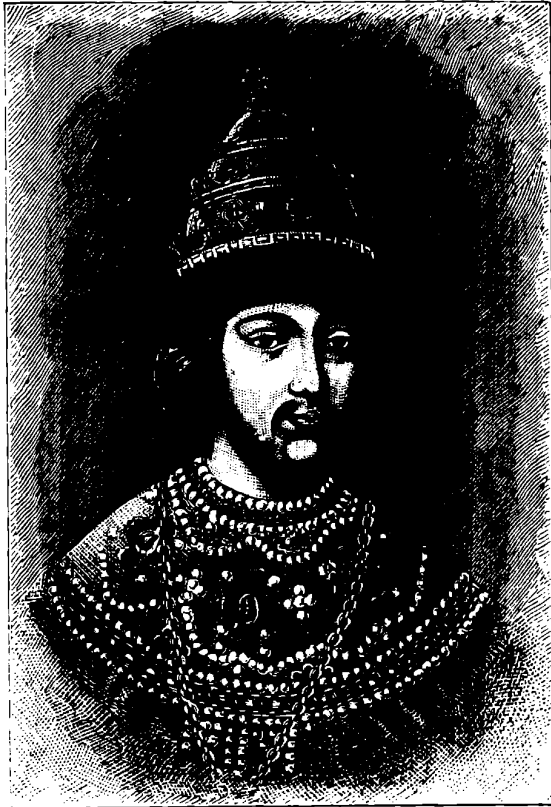
Царь Феодоръ Алексѣевичъ.