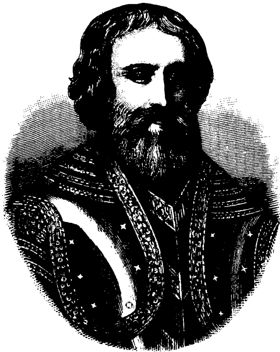
Бояринъ Артамонъ Сергѣевичъ Матвѣвъ.

— А вѣдь я жениха-то для твоей воспитанницы нашель.