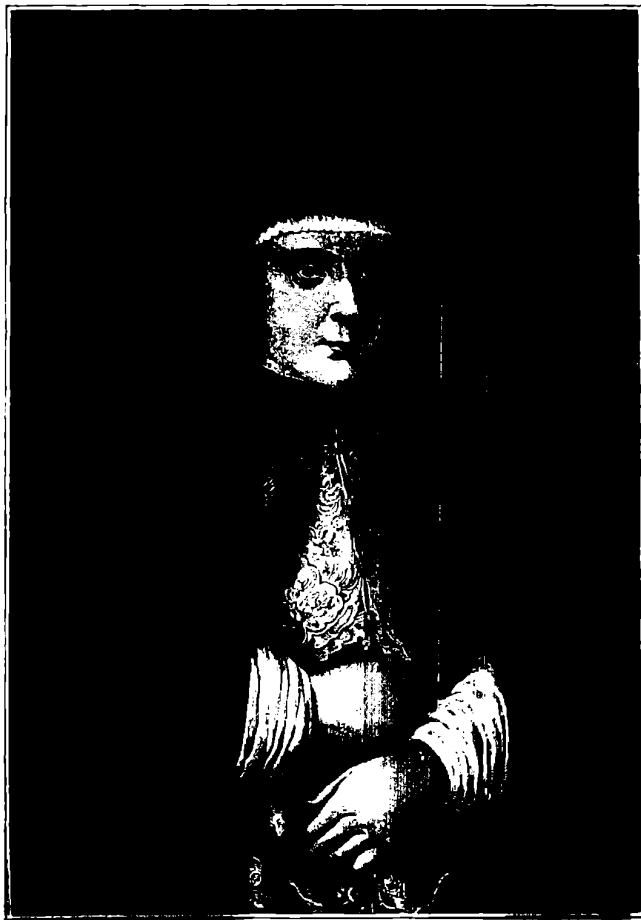
Наталья Кирилловна Нарышкина.

Красивая, скромная и благочестивая Наталья Кирилловна очень понравилась государю, который, бывая у Матвѣва, каждый разъ подолгу разговаривалъ съ молодой дѣвушкой и, наконецъ, плѣненный ея качествами, рѣшилъ на ней жениться.