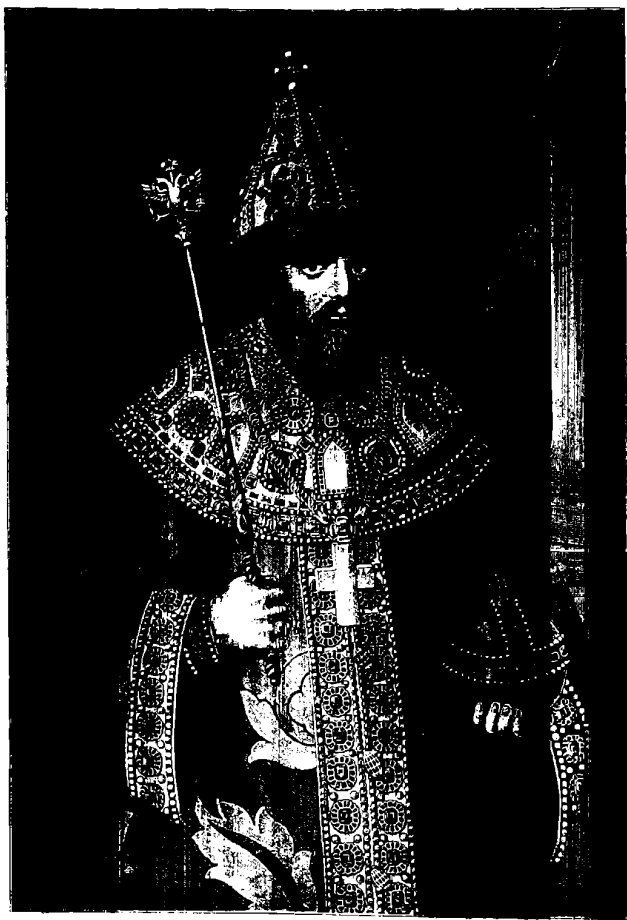
Царь Алексѣй Михайловичъ.

всѣ сношенія съ иностранными государствами, часто сталкивался съ иноземцами и отчасти даже самъ жилъ на иностранный ладъ. Домъ свой онъ устроилъ по-заграничному, обставилъ его привозной мебелью, украсилъ часами, картинами, и, кромѣ того, перенялъ у иностранцевъ обычай не