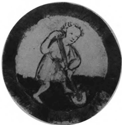
Вскапывание почвы (из рукописи XIV века)

ное орудие — соху. В соху впрягали обыкновенно одну лошадь, но соха не переворачивала пласты земли, а только проводила по поверхности почвы борозду, да и то для этого нужно было с силой налечь на неё. После пахоты поля бороновали, а иной раз приходилось ещё разбивать комья земли вручную — лопатами или кольями. Огороды обычно обрабатывали также вручную — заступами или мотыгами.