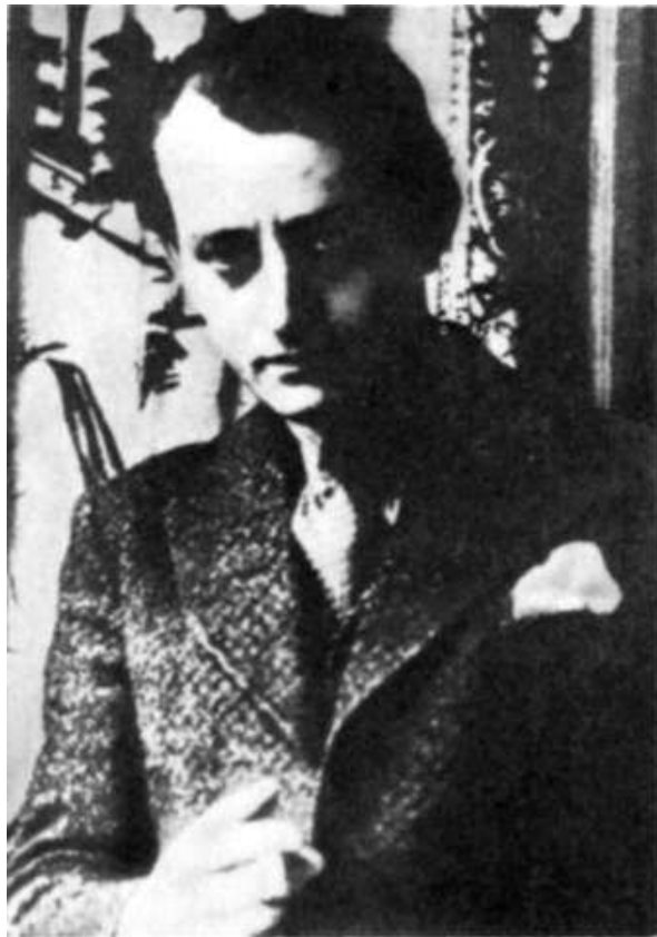
В годы работы над романом «Удел человеческий»