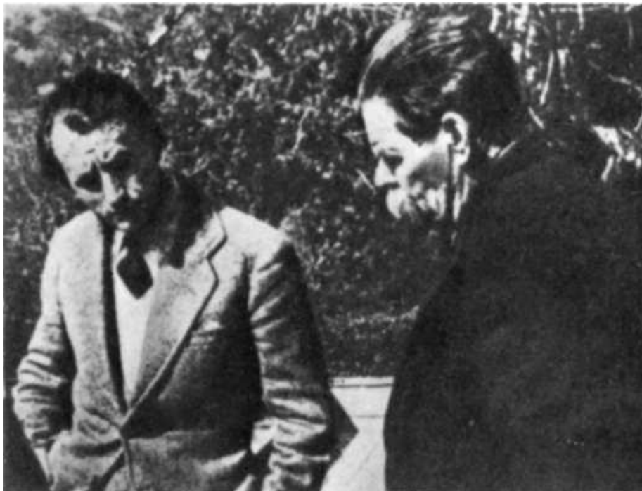
С. М. Горьким (1934)