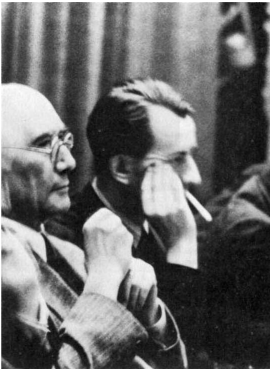
А. Мальро и А. Жид перед вручением петиции в защиту Г. Димитрова