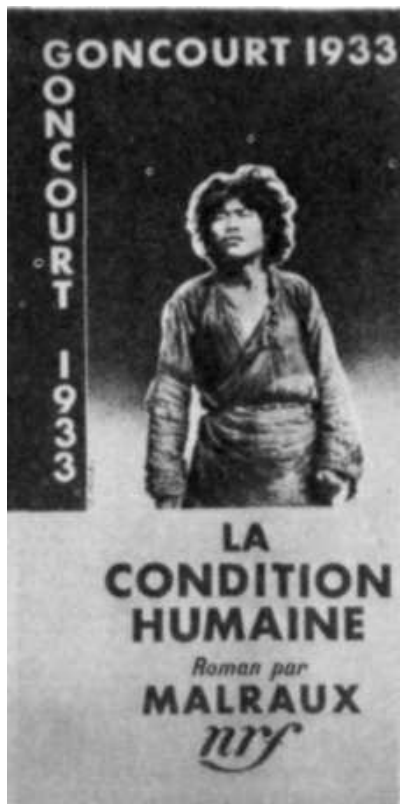
Обложка романа «Удел человеческий»