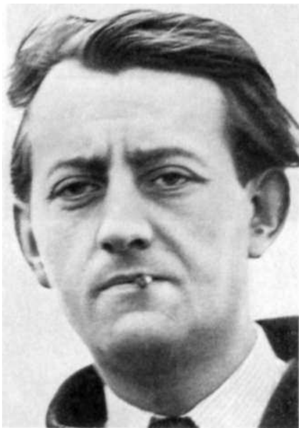
В момент получения Гонкуровской премии (1933)