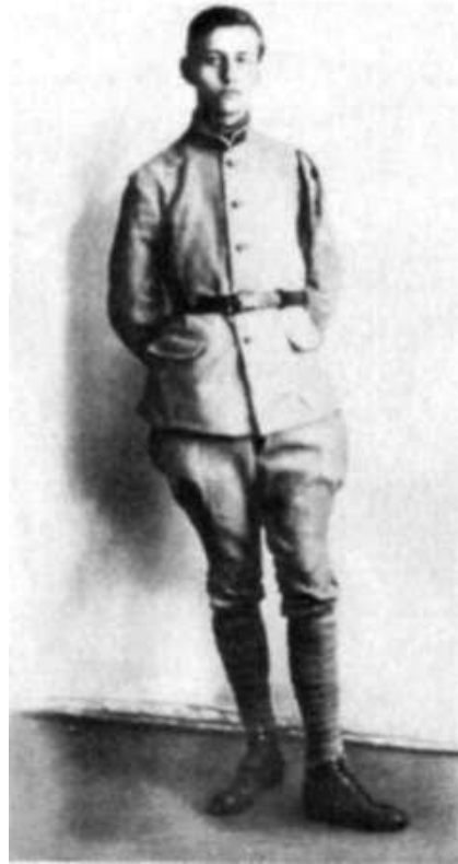
На военной службе