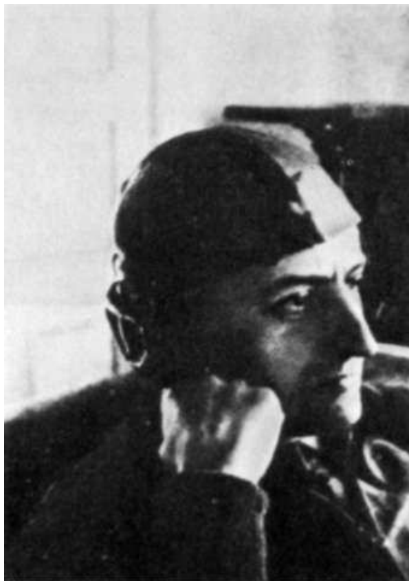
В небе Испании