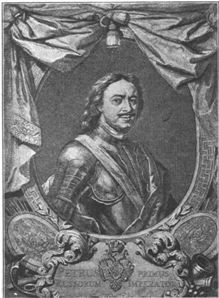
Императоръ Петръ Великій, основатель Петербурга.