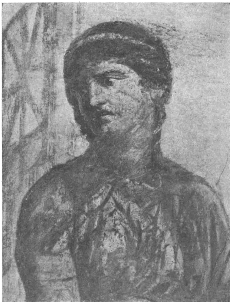
3. Медея по изображенію на помпеянскій фрескѣ.

Извѣстно нѣсколько писателей съ именемъ Филострата; одинъ, современникъ династіи Северовъ, жилъ приблизительно отъ 170 до 249 по Р. Х.; другой былъ его зять и младшій современникъ, а третій внукъ. Приведенный отрывокъ взятъ изъ сочиненій втораго Филострата.