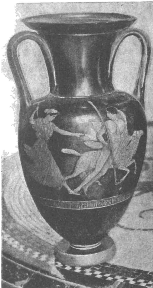
2. «Ноланская» краснофигурная амфора Национальнаго музея въ Неаполѣ середины V в. до Р.Хр. съ изображеніемъ Ино, преслѣдующей Фрикса, который уплываетъ на баранѣ.

посѣять зубы дракона: онъ получили отъ Аены половину тѣхъ зубовъ, которые Кадмъ посѣялъ въ Фивахъ. Между тѣмъ какъ Ясонъ недоумѣвалъ, какъ ему запрячь быковъ, въ него влюбляется Медея: это была дочь Эты и Иди, дочери Океана, волшебница; боясь, чтобы Ясонъ не погибъ отъ быковъ, она тайкомъ отъ отца обѣщала ему помочь въ дѣлѣ запряжки быковъ и достать руно, если онъ поклянется взять ее въ жены и увезетъ съ собой въ Элладу. Когда Ясонъ по-