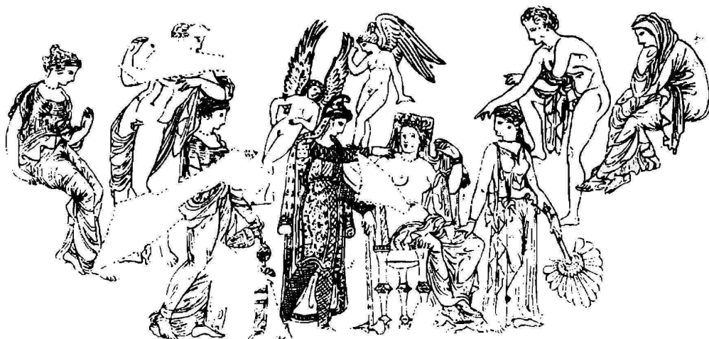
7. Елена и Парисъ, окруженные эротами, дѣвушками и юношами (Диоскурами).—Картина краснофигурнаго кратера въ Государственномъ Эрмитажѣ, въ Петроградѣ.

Объ авторѣ см. прим. къ № 2, II. Отрывокъ заимствованъ изъ «Разказа о герояхъ», изложеннаго въ видѣ діалога между суевѣрнымъ виноградаремъ (В) изъ Херсонеса Эракійскаго и финикійскимъ морякомъ (Ф). Мэотійское озеро—Азовское море. Борисѣенъ—Днѣпръ.