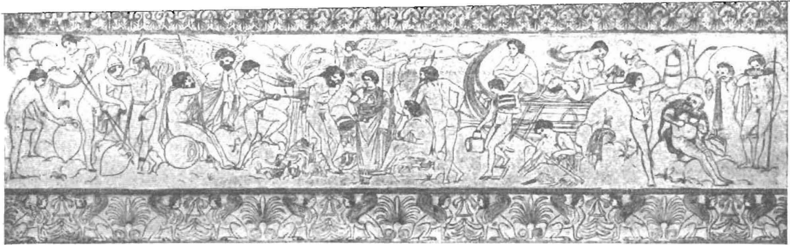
1. Аргонавты въ странѣ бибриковъ, въ Виоиніи. Развернутый рисунокъ съ цисты Фикорони (до середины III в. до Р. Хр.) въ музеѣ Киркера въ Римѣ. Гравированная картина цисты сдѣлана подъ влияніемъ греческой картины 2-ой половины IV в. до Р. Хр.