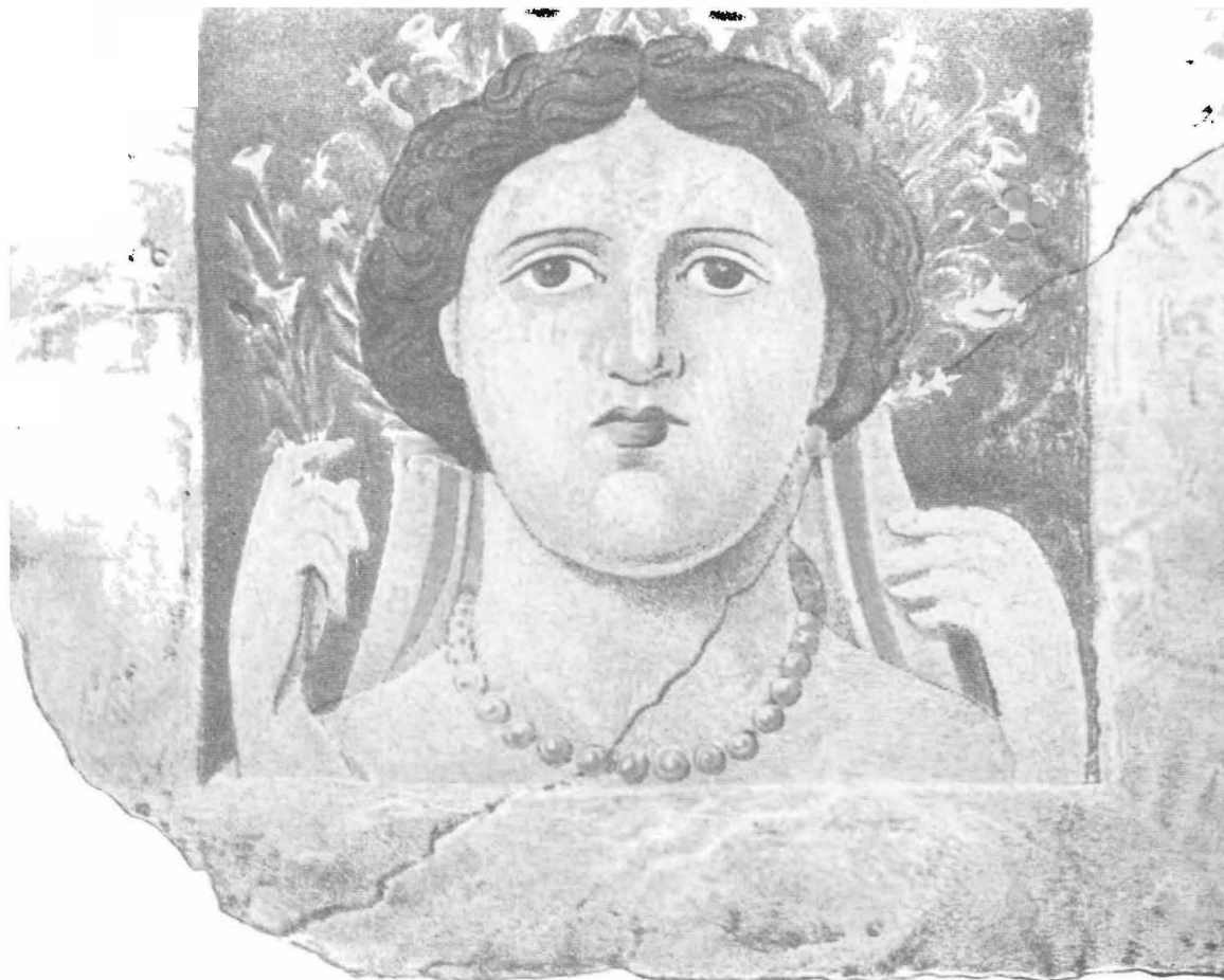
1. Плита съ изображеніемъ бюста Деметри въ расписномъ склепѣ кургана Бол Близицы IV—III в. до Р. Хр.