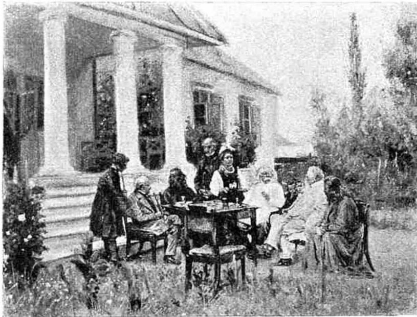
Помѣщики въ Малороссіи (В. Маковского).

Но даже эти исключительно неблагоприятныя для реформы условія не исчерпываютъ всѣхъ препятствій, съ которыми ей пришлось встрѣтиться у