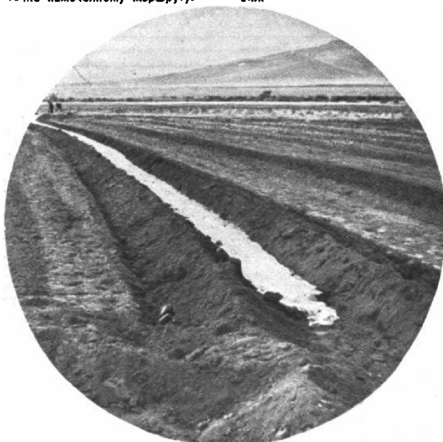
...Но только что врезанным временным оросительным каналам побегала пеннистая вода.

— Что же будете вы делать теперь? — спрашиваю я у Турбина. — Так ведь это — начало. Сейчас только и начинается главное — внедрение, — ответил он.