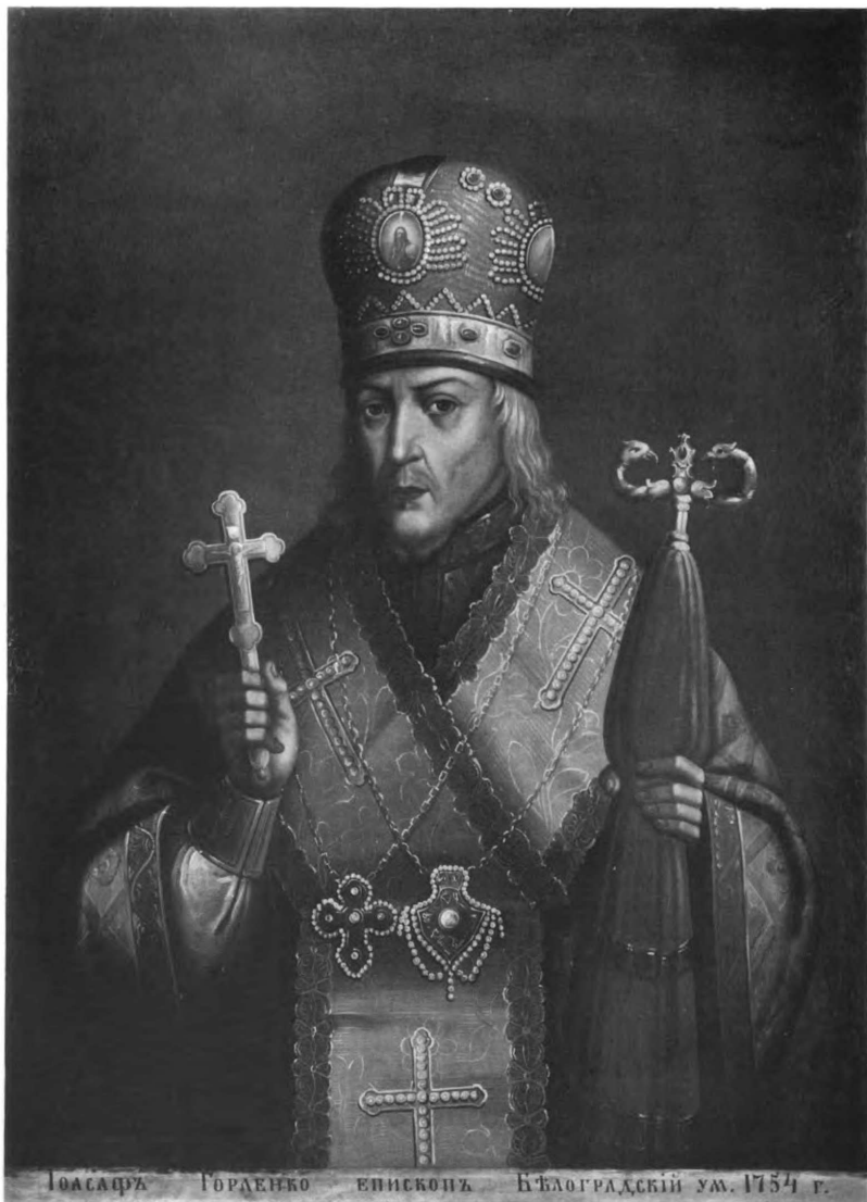
СВЯТИТЕЛЬ ЮАСАФЪ ГОРЛЕНКО ЕПИСКОПЪ БѢЛОГРАДСКІЙ И ОБОЯНСКІЙ (р. 8 Сентября 1705 г. † 10 Декабря 1754 г.)