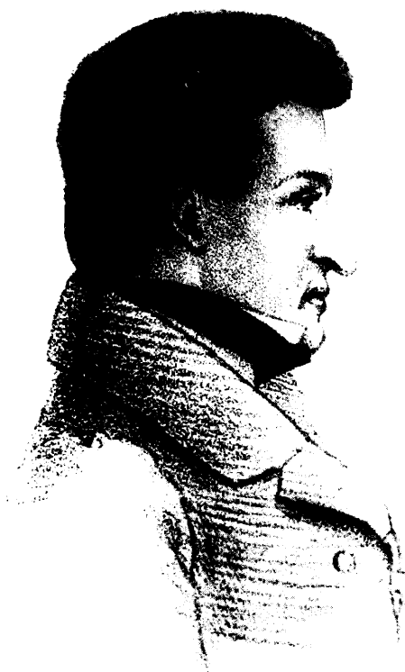
СТЕПАН ПЕТРОВИЧ ЖИХАРЕВ