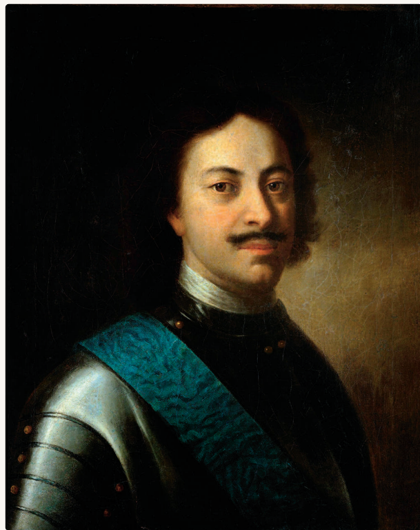
Таннауер И. Г. Портрет Петра I

Восемнадцатый век вошел в русскую историю как «век императриц». После смерти Петра Великого на российском троне сменяют друг друга его жена, императрица Екатерина I, его племянница Анна Иоанновна, внучатая племянница Анна Леопольдовна, дочь Петра Елизавета и супруга его внука Петра III — Екатерина II. Смена правительниц на московском престоле стала возможной после того, как в 1722 году Петр I подписал Указ о престолонаследии, который отменял древний обычай передавать престол от отца к сыну. Теперь монарх сам мог назначать своего наследника, правда лишь из числа прямых родственников. Сам Петр не успел воспользоваться собственным указом, и после его смерти русский трон перешел его супруге Екатерине I, которую поддержали ее сторонники, и прежде всего фаворит покойного императора князь Александр Данилович Меншиков. Для помощи императрице в делах государственного правления — «для государственных важных дел» —