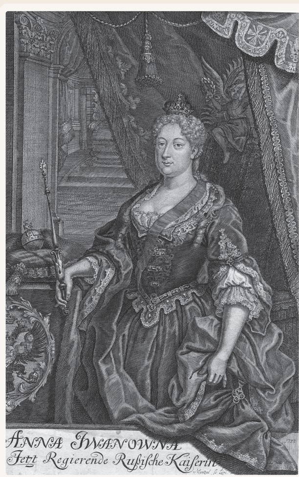
Портрет Анны Иоанновны

за что ему был пожалован титул барона. Принял участие в составлении «Табели о рангах» и в организации Коллегии иностранных дел. После смерти Петра I вошел в число членов Верховного тайного совета. Был воспитателем юного императора Петра II и участвовал в заговоре против А. Д. Меншикова. В 1730 году, после смерти Петра II, уклонился от подписания особых условий — «кондиций», ограничивавших власть императрицы Анны Иоанновны, чем завоевал ее симпатии, и, получив титул графа, фактически стал руководителем внутренней и внешней политики империи. В 1734 году был назначен канцлером. После смерти Анны Иоанновны, во время правления Анны Леопольдовны, Остерман сумел сблизиться с Б. К. Минихом и получил звание генерал-адмирала. После