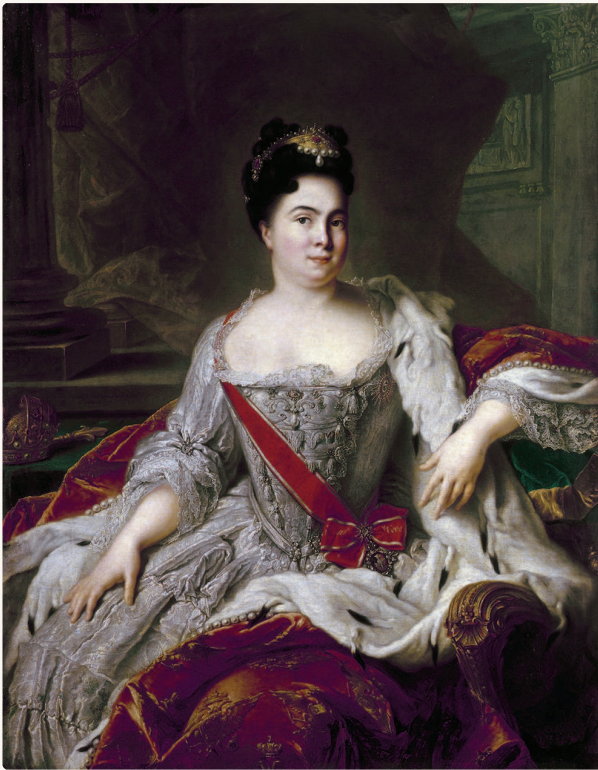
Ж.-М. Наттье. Портрет Екатерины I, 1717 г.