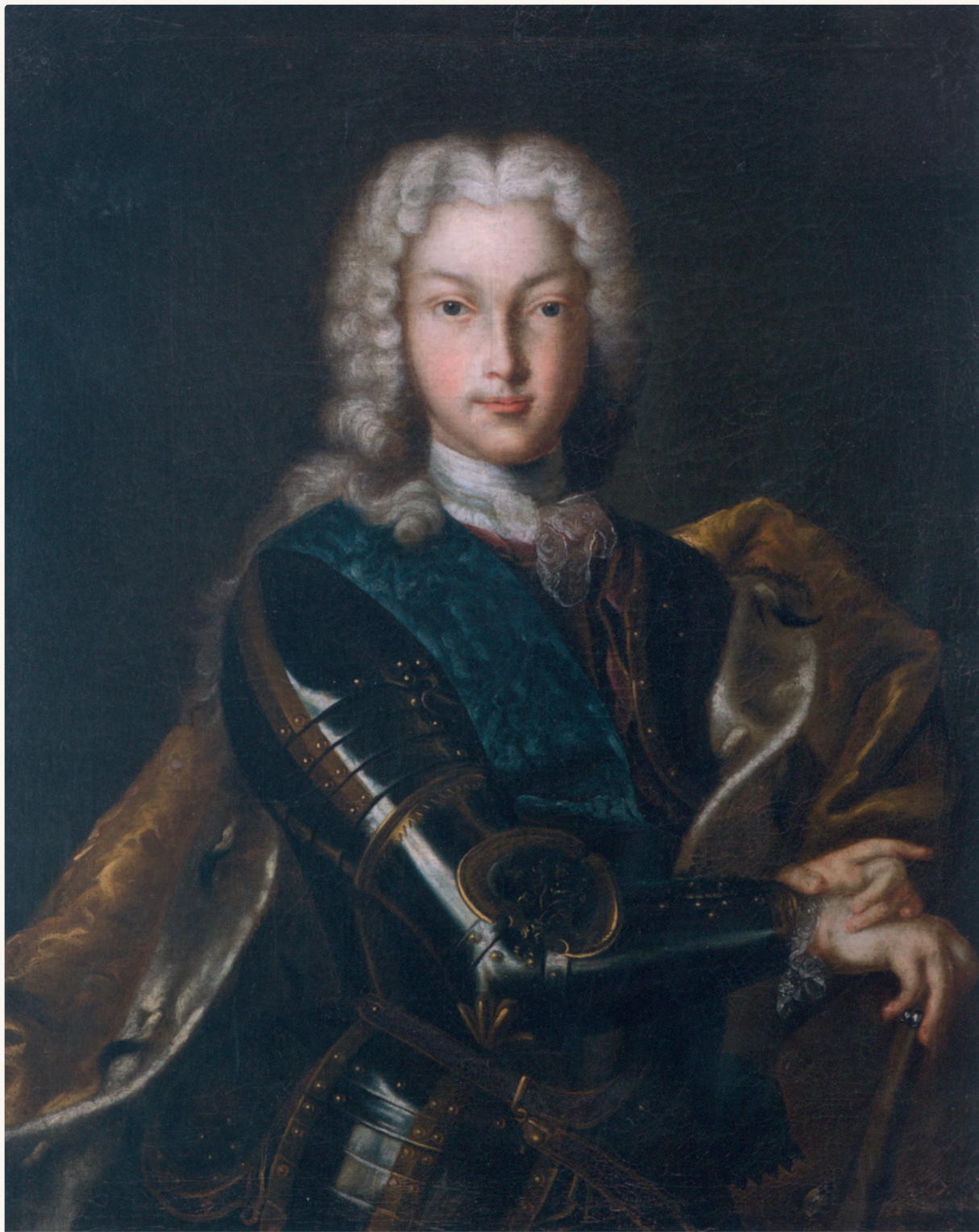
Великий князь Петр Алексеевич