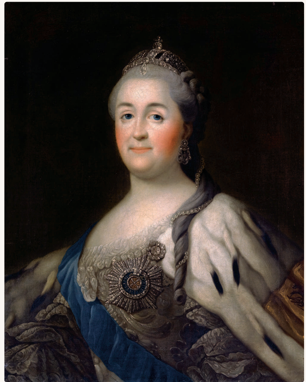
Портрет Екатерины Великой

был учрежден Верховный тайный совет, высший совещательный орган при монархе.