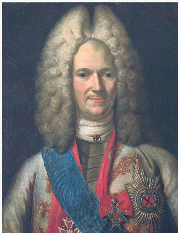
Портрет А. Д. Меншикова

Андрей Иванович Остерман — российский государственный деятель, дипломат, член Верховного тайного совета. Родился в Вестфалии в семье лютеранского пастора. В юности учился в Йенском университете, овладел пятью европейскими языками, но, убив на дуэли противника, был вынужден бросить учебу и бежать в Голландию. Поступил на русскую службу, выучил русский язык и был определен в посольскую канцелярию. Стал одним из «авторов» Ништадтского мирного договора, завершившего Северную войну,