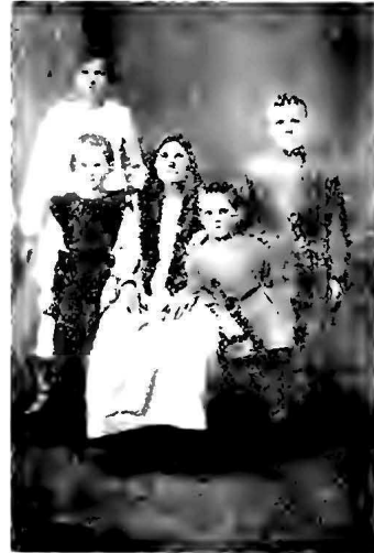
Страждущее казацье семейство одной изъ горныхъ станицъ на Кубани въ 1927 году. Глава ея — отецъ и мужъ — за рубежомъ. Школяры, вѣрные казацкой традиціи — снялись при отцовскихъ кинжалахъ.