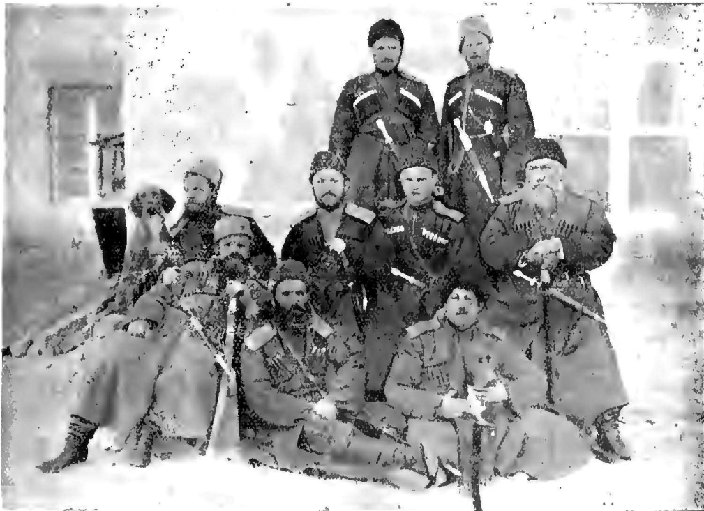
Группа г. офицеровъ 1-го Кубанскаго пластунскаго баталіона въ гор. Артвинѣ, въ 1891-омъ году.

Пластуны стрѣляли дикихъ звѣрей, которыхъ тогда въ дѣтровскихъ плавняхъ было вдоволь. Пластунами, говорятъ, назывались потому, что были «непосѣдами», все шатались по плавнямъ и такъ какъ больше имъ приходилось мѣсить грязь, чѣмъ ходить по сухому, сирѣчь «пластать», то и прозвались «пластунами».