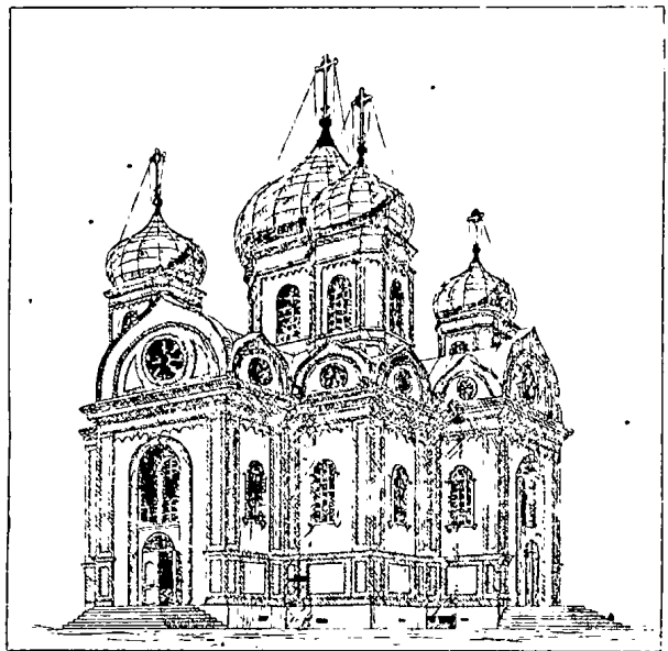
Кубанскій Войсковой Собор