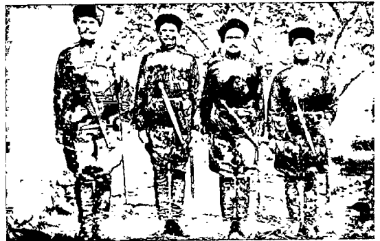
Характерные типы Кубанскихъ казаковъ Кубанской Казачьей дивизіи въ Сербіи.

— Увы, ни пользы намъ — ни тебѣ — Славы!..