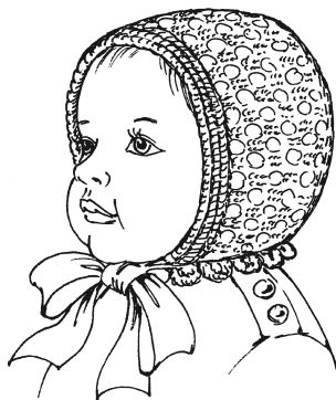
Рисунок 2. Чепчик ажурный для новорожденного

Передний край чепчика обвязать 1 рядом «рачьего шага» (столбики без накида выполнять справа налево) (рис. 2.).