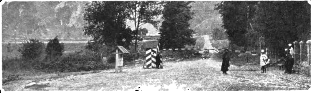
Военно-Груз. дорога. Балтинская застава.