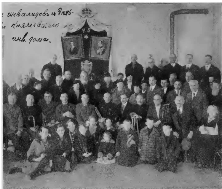
Група инвалидовъ въ Кяяжево (Болгарія).