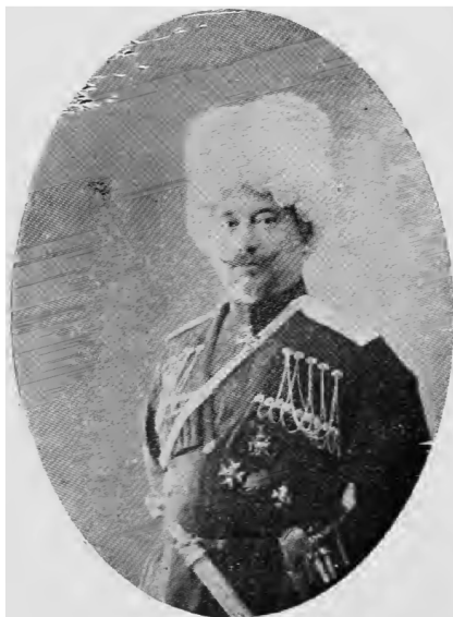
Генераль-отъ-кавалеріи Н. Н. Баратовъ.

Совсѣмъ въ другомъ положеніи находились инвалиды. Многіе изъ нихъ еще лежали на больничныхъ кроватяхъ. Никакихъ средствъ не было и не могло быть. Ни на какую государственную помощь рассчитывать они не могли. Россія была далеко, государственная власть перестала суще-