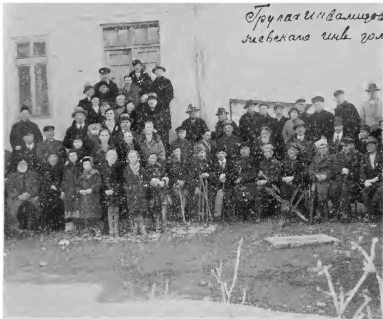
Група инвалидовъ въ Княжево (Болгарія).