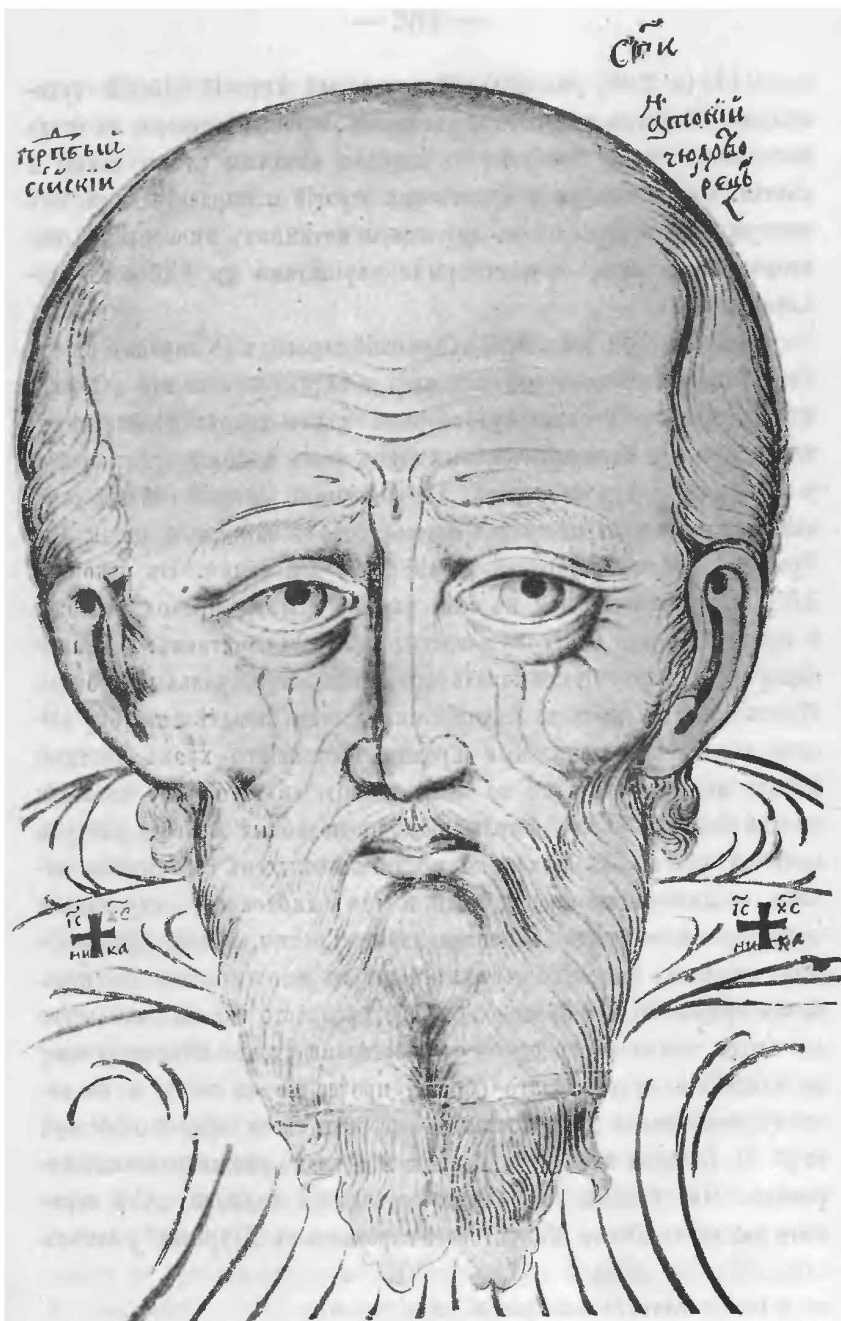
Рис. 40. Препод. Антоній Сісскій чудотворець.