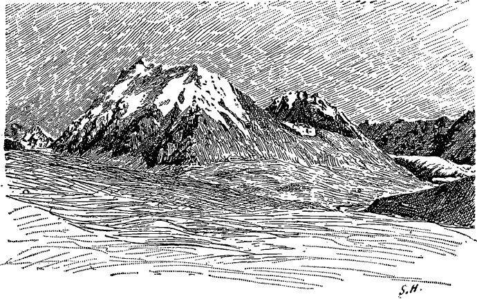
Гинду-ку; видъ около перевала Упрангъ. (Съ рисунка автора).