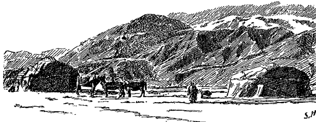
Ауль въ долинѣ Сары-коль. (Съ рисунка автора).

Снѣгъ достигалъ здѣсь 2 ф. глубины. Киргизы вырубали въ обледенѣлой снѣжной корѣ ступеньки, по которымъ осторожно и сводили лошадей. При этомъ одинъ держалъ лошадь за хвостъ, чтобы затормозить въ случаѣ, если животное по-