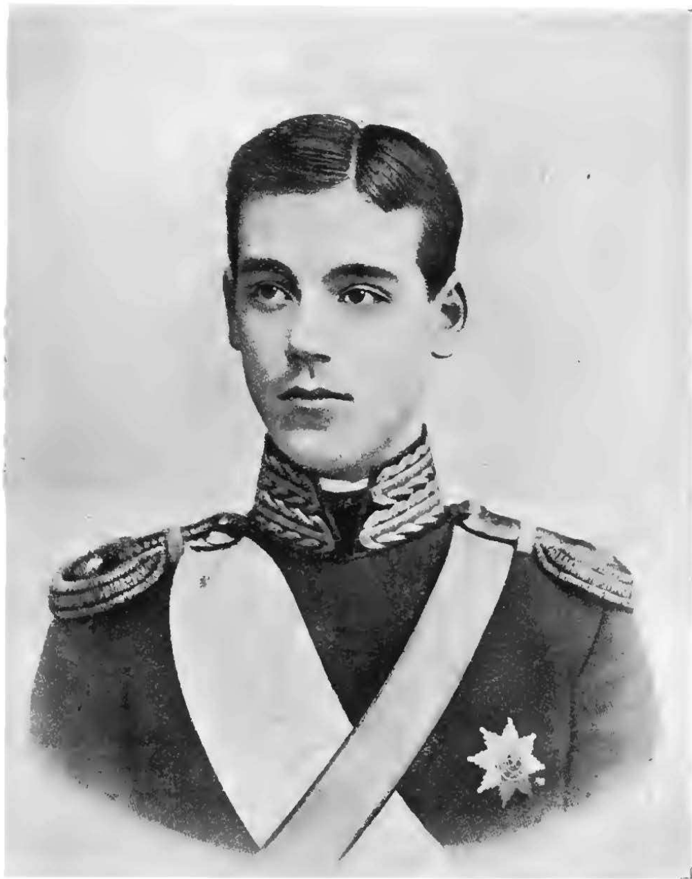
Е. И. В. Великій Князь Михаилъ Александровичъ въ чинѣ подпор. Гвард. Конн. Артил. — 1899 г. Августѣйшій Михайловецъ, выпуска 1898 г.