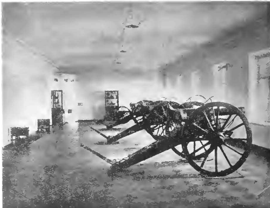
Учебный залъ (Клиновыя пушки обр. 1877 г. и горная пушка обр. 1882). Изъ альбома 1895 г.

Это былъ общій любимецъ, чудная личность, хотя и большой оригиналь. Носилъ всегда сюртукъ изъ толстѣйшаго драпа, съ пришитыми наглухо погонами. Если приходилось надѣвать сюртукъ съ эполетами, то они пристегивались поверхъ погонъ. Это особенно казалось страннымъ тогда, когда, до производства въ полковники, онъ носилъ капитанскіе эполеты. Въ то время всѣ говорили, что будто бы Левъ Львовичъ Кирпичевъ, провалившись на экзаменѣ изъ Механики, не то въ Училищѣ, не то въ Академіи, далъ себѣ слово быть профессоромъ Механики. Если это правда, то слово свое сдержалъ, такъ какъ при миѣ онъ и читалъ Механику въ Училищѣ, а въ Академіи — профессоръ Вышнеградскій. Въ дальнѣйшемъ я еще вернусь къ личности Л. Л. Кирпичена.