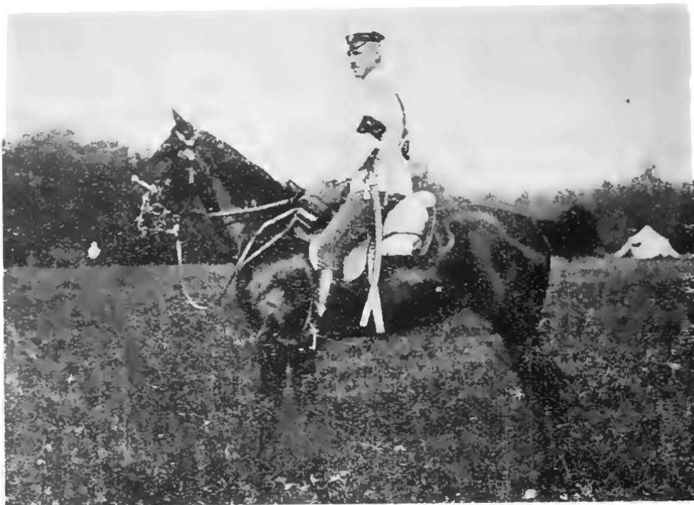
Е. И. В. Великій Князь Михаилъ Александровичъ.