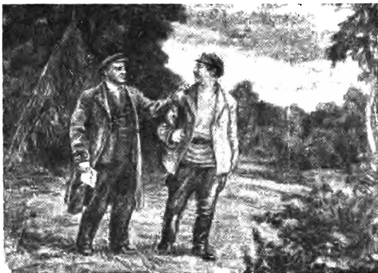
Рисунок А. Н. Малиновского.