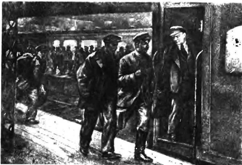
«Перед последним звонком Владимир Ильич вышел на заднюю площадку последнего вагона».