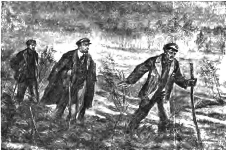
Рисунок И. М. Лебедева.

«В темноте сблизясь с пути и попали в полосу лесного пожара... Горел торф». (В. И. Ленин на пути к станции Левашово при переезде в Финляндию.)