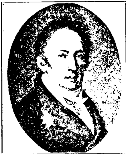
Карамзинъ Н. М.

4. Аглая. Москва. Въ университетской типографіи, у Редигера и Клаудія, 1791 года. Изданіе 2-е, въ 8 д. л. Книжка 1-я 145, книжка 2-я 192 стр.