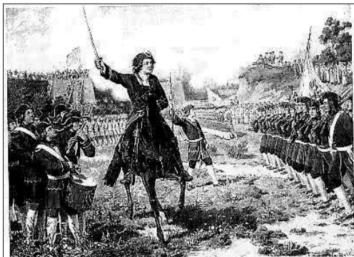
Военная игра потешных войск Петра. А.Д. Кившенко

ками, генерал-фельдмаршал), князь А.И. Репнин (полководец, в Полтавской битве командовал центром русской позиции, генерал-фельдмаршал), Ф.М. Апраксин (потом всю жизнь посвятив строительству Российского флота, отличился в Гангутском морском сражении, первым удостоен высшего военно-морского чина – генерал-адмирала), потомок знатного московского рода И.И.