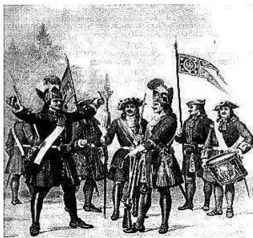
Гренадёр, обер-офицер, пикинёр и барабанщик Преображенского полка

Бутурлин и другие, которых А.С. Пушкин назвал потом « птенцами гнезда Петрова ». Также было и немало лиц происхождения « подлого », с том числе самый удачливый из них – А.Д. Меншиков, « Алексаши-ка », продававший мальчишкой вразнос горячие пирожки, сын конюха. Он прошёл путь от царского денщика до генералиссимуса русской армии, светлейшего князя. При Петре I он фактически исполнял обя-