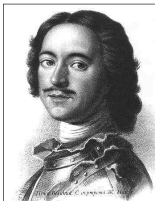
Петр Великий. С портрета Ж. Натье

На четвёртом году жизни Петр потерял отца. Началась долгая придворная борьба за престол. Подросший Петр в политические дела не вмешивался. Жил он с матерью в селе Преображенском. Основное своё внимание в эти годы Петр отдавал воинским играм, « потехам ». К ним он привлёк целую толпу сверстников и « робяток » постарше. От покойного отца остались целые службы по конюшенному ведомству, по соколиной охоте. Всех сокольников, стольников и прочих, он собирал в батальоны своих « потешных ». Помимо знатного люда, включал в их ряды и бывших холопов, прочих « простецов ». Лишь бы были они людьми шустрými, весёлыми и исполнительными. Так собралась довольно пёстрая группа – два батальона, примерно по 300 человек. Среди « потешных » были князь М.М. Голицын (службу начал барабанщиком, а в Полтавскую битву командовал Гвардией – лейб-гвардии Семёновским и Преображенским пол-