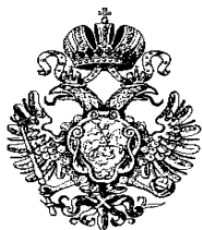
Печать Петра I, 1721 г.

Была та смутная пора, Когда Россия молодая, В бореньях силы напрягая, Мужала с гением Петра.