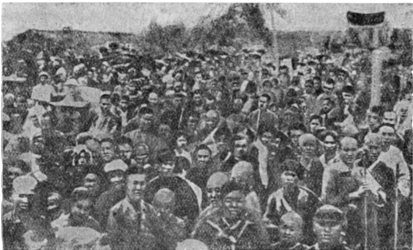
Митинг красноармейцев совместно с населением.