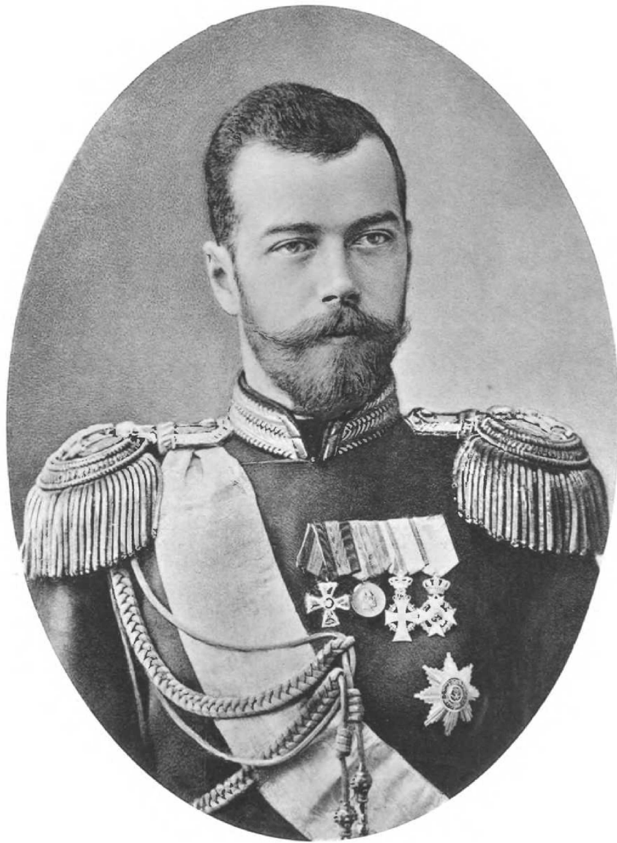
ИМПЕРАТОРЪ НИКОЛАЙ II.