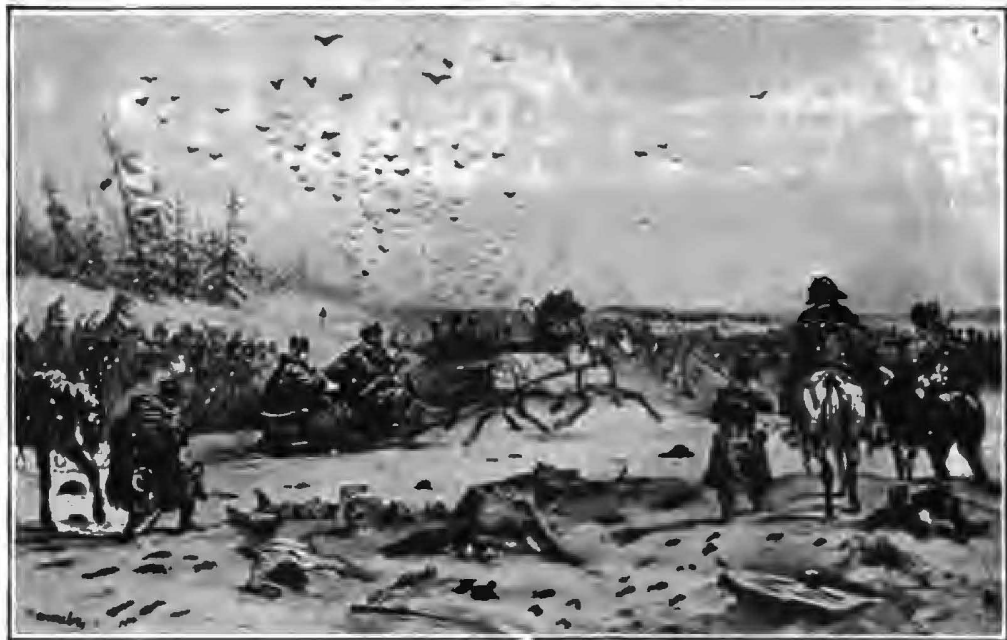
Возвращеніе Наполеона изъ Россіи. (Карт. Алексѣева. 1849 г.).

креть о таксъ обрадоваль было населеніе, но радость смѣнилась печалью, когда въ результатъ ихъ продуктъ исчезъ совершенно съ рынка. Пришлось прибѣгать къ реквизиціямъ, а въ настоящее время захватывать иногда даже необходимые для самихъ земледѣльцевъ запасы. Въ дома упорствующихъ были введены гарнизэры 1) и повсюду произведена точная провѣрка запасовъ. Виновныхъ въ дачь ложныхъ показаній немедленно арестовывали и предавали суду. Но все доступное нашей регистраціи количество хлѣба будетъ скоро исчерпано, ничтожность нашей работы не замедлитъ обнаружиться, и тогда реквизицію придется производить наугадъ, что отниметь у дѣла общественнаго продовольствія всякую почву.