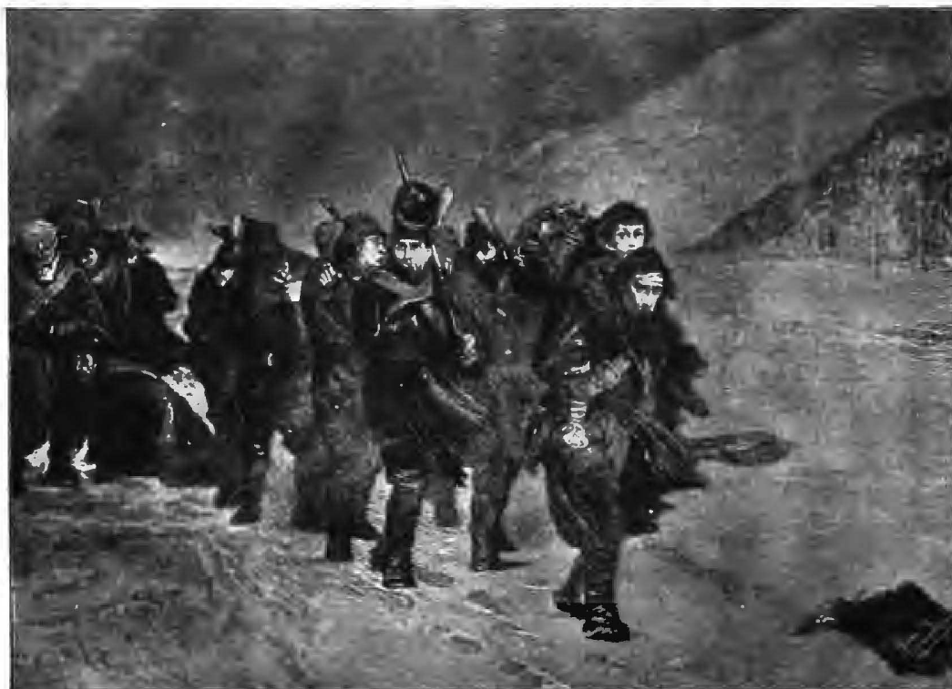
Солдаты великой арміи на обратномъ пути. (Л. И. Поттъ).

Официальнымъ благополучіемъ продолжала дышать и пресса. Но какъ ни старалось правительство занять вниманіе общества «маленькими войнами» на страницахъ газетъ, оно съ самаго начала было приковано къ