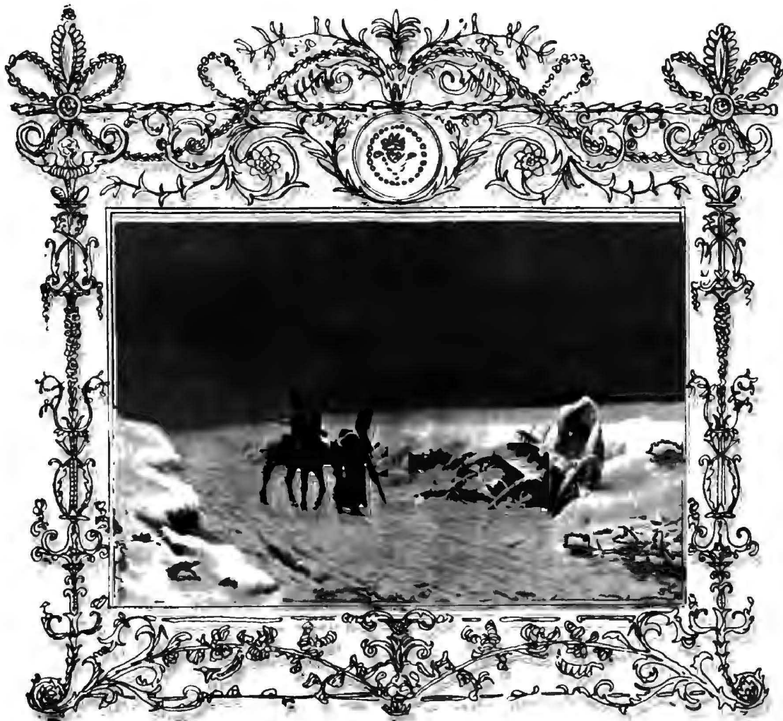
Эпизодъ изъ отступленія (Вайса).