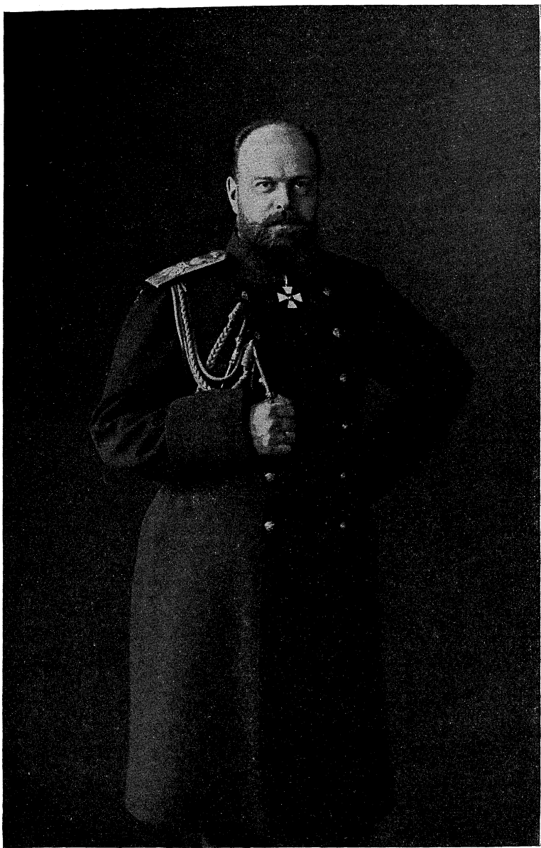
Императоръ АЛЕКСАНДРЪ III, Державный Родитель Государя Императора НИКОЛАЯ АЛЕКСАНДРОВИЧА.