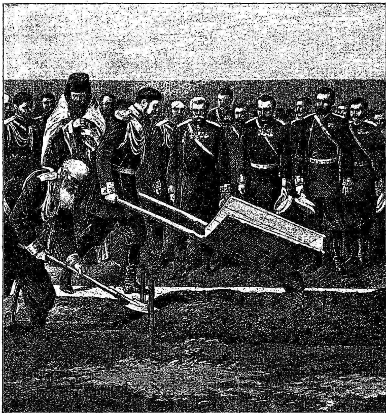
Закладка ГОСУДАРЕМЪ ИМПЕРАТОРОМЪ (въ бытность Наслѣдникомъ Цесаревичемъ) великаго Сибирскаго пути.

великое дѣло. Позднѣе, будучи Цесаревичемъ, Государь прошелъ полное общее образованіе, въ совершенствѣ изучилъ предметы, которые необходимо знать Монарху, для управленія такимъ обширнымъ государ-