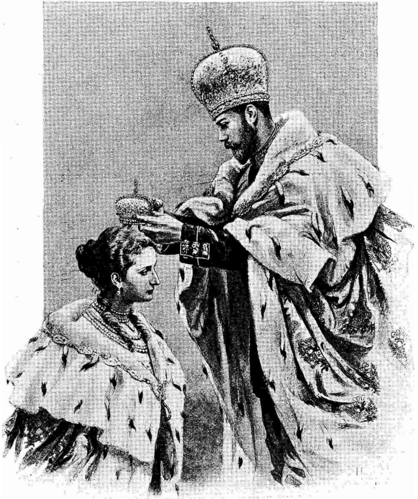
Священное Коронованіе Ихъ Императорскихъ Величествъ. ГОСУДАРЬ ИМПЕРАТОРЪ возлагаетъ корону на Государыню Императрицу АЛЕКСАНДРУ ФЕОДОРОВНУ.