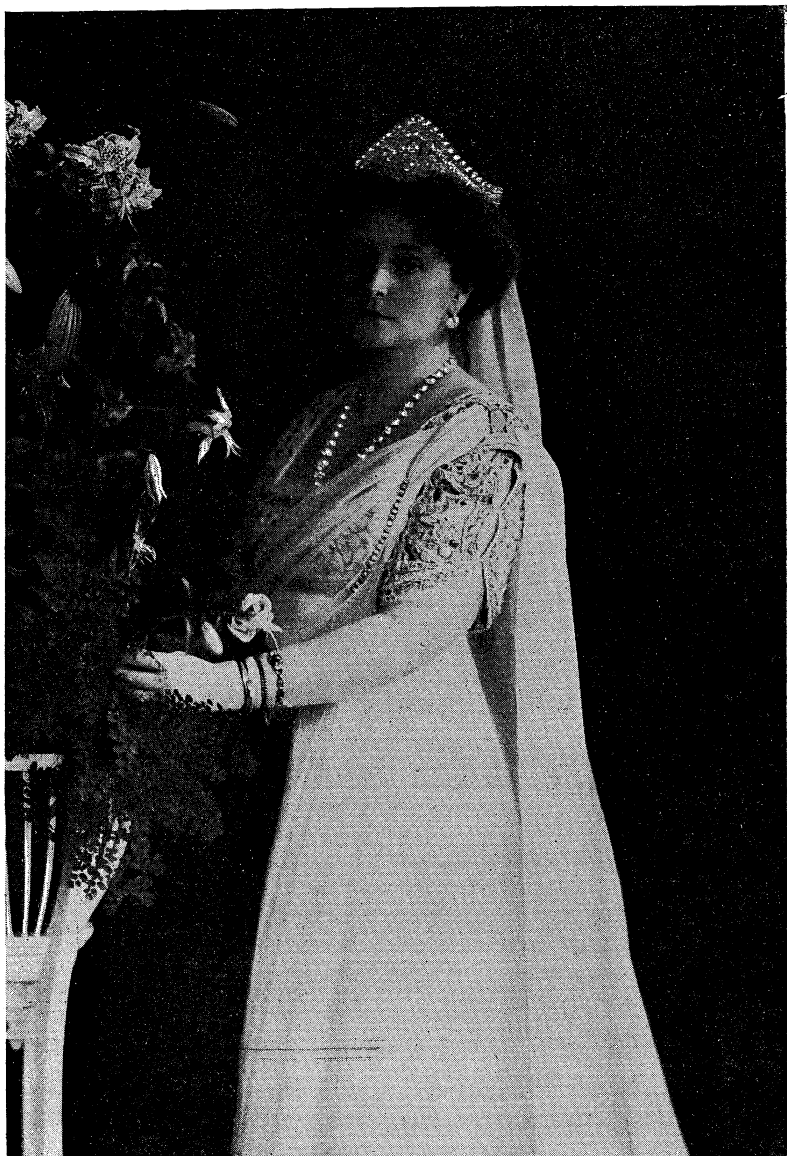
Ея Императорское Величество Государыня Императрица АЛЕКСАНДРА ФЕОДОРОВНА.