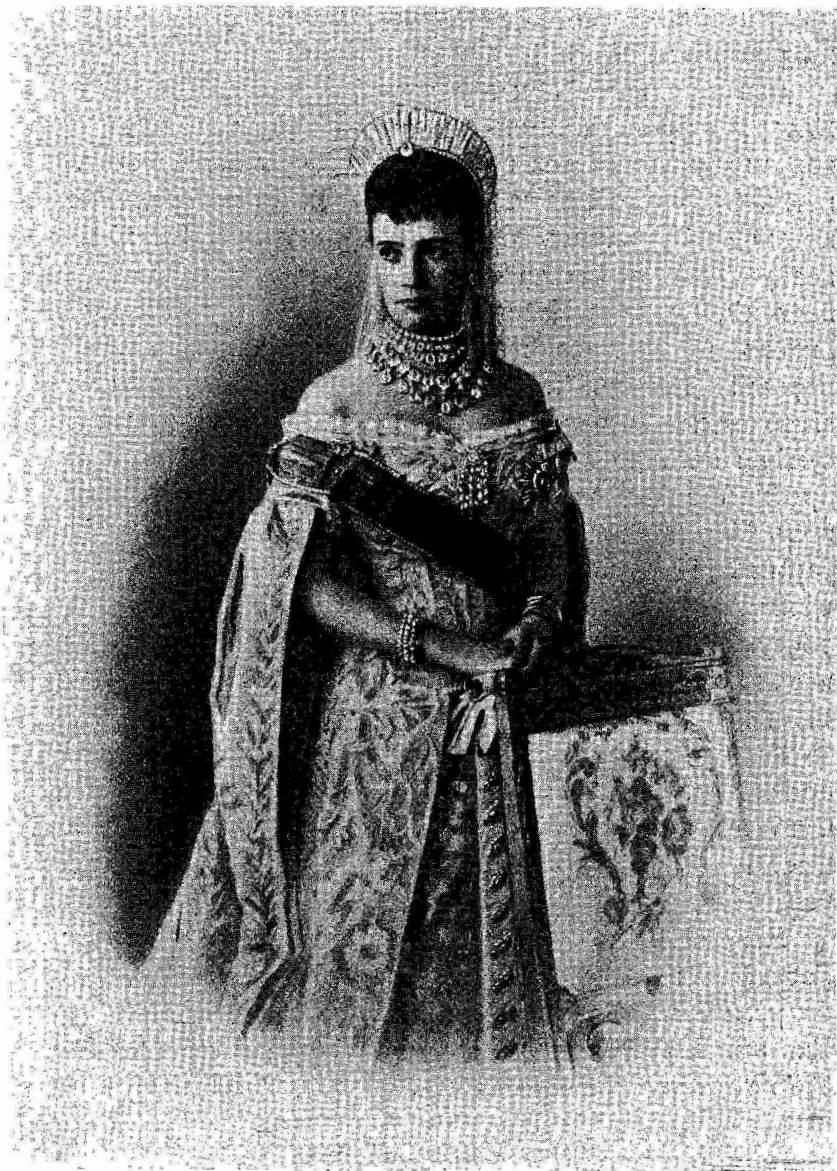
Ея Императорское Величество Государыня Императрица МАРІЯ ФЕОДОРОВНА, Августѣйшая Родительница Госу- даря Императора НИКОЛАЯ АЛЕКСАНДРОВИЧА.